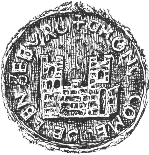
Fig. 1 Siegel Kunos v. Lenzburg, 1167.

Grafen von Neuenburg führten damals mehrfach eine in breiten Zügen gehaltene Darstellung ihrer Burg im Siegel, oft ohne, zuweilen auch mit ihrem Wappenschild 3 . Walter, Freiherr von Hasenburg, tat in seinem 1255 vorkommenden Siegel das gleiche (Fig. 2) 4 , und im fernen Westfalen erscheint ebenfalls beim Grafen Simon I. von Teklenburg 1158 und 1203, sowie bei seinem Sohn Otto II. 1226, statt des Wappens eine Ansicht ihrer Burg im Siegel 5 . Es kann das um so weniger auffallen, als in Stadtsiegeln aus dem 13. Jahrhundert Darstellungen von Gebäuden gar nicht so selten sind.