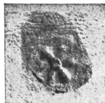
Fig. 66 Cachet du 25 avril 1538.

En effet, l'Armorial Vaudois, de Mandrot, indique comme armes Turtaz d'Orbe: «d'azur au pentalpha d'or, accompagné aux flancs dextre, senestre, et «en pointe, de trois étoiles de même.»