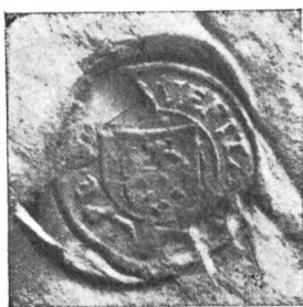
Fig. 64 Cachet du 26 nov. 1540. (1 re lettre).

La légende qui entoure l'écusson porte: « Veritas Vulnere Viret ». Herminjard indique aussi cette devise vol. VI, n° 919, p. 381.