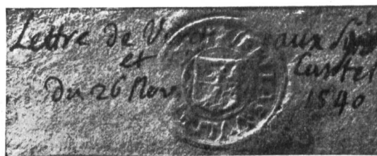
Fig. 65 Cachet du 26 nov. 1540. (2 e lettre).