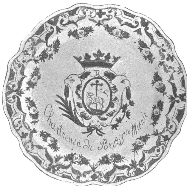
Fig. 164 Assiette d'un service en faïence du Port-Sté-Marie, et à ses armes, d'après la planche XX du Manuel du Collectionneur de faïences anciennes (op. cit.).