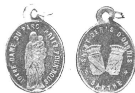
Fig. 165 Fig. 166 Médaille de N.-D. du Parc aux armes de la chartreuse de ce nom.