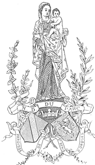
Fig. 167 Image armoriée de N.-D. du Parc.