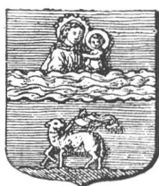
Fig. 161 Blason de la chse du Port-Sté-Marie, d'après M. le chanoine Mioche, historien du monastère.

et accompagnée en pointe d'un agneau pascal de même, et autour cette inscription: SIGILL . CARTH . PORTUS B. MARIE.» (Pl. XIX)