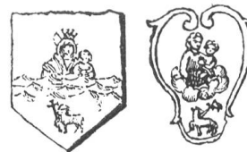
Fig. 162 Fig. 163 Armoiries du Port-Sté- Marie, sur le plan de cette chse dans le Monasticon cartusiense en préparation.

La description de l' Armorial de France reproduit exactement le type des sceaux III (1747) et IV (1774) sans écu de Vallier (p. 107-108), moins les étoiles qui y forment une auréole sur la tête de la Vierge et qu'on retrouve sur le dessin de M. Mioche. L'agneau pascal seul figure sur un sceau beaucoup plus ancien, de 1343, le II e de Vallier (p. 106-107).