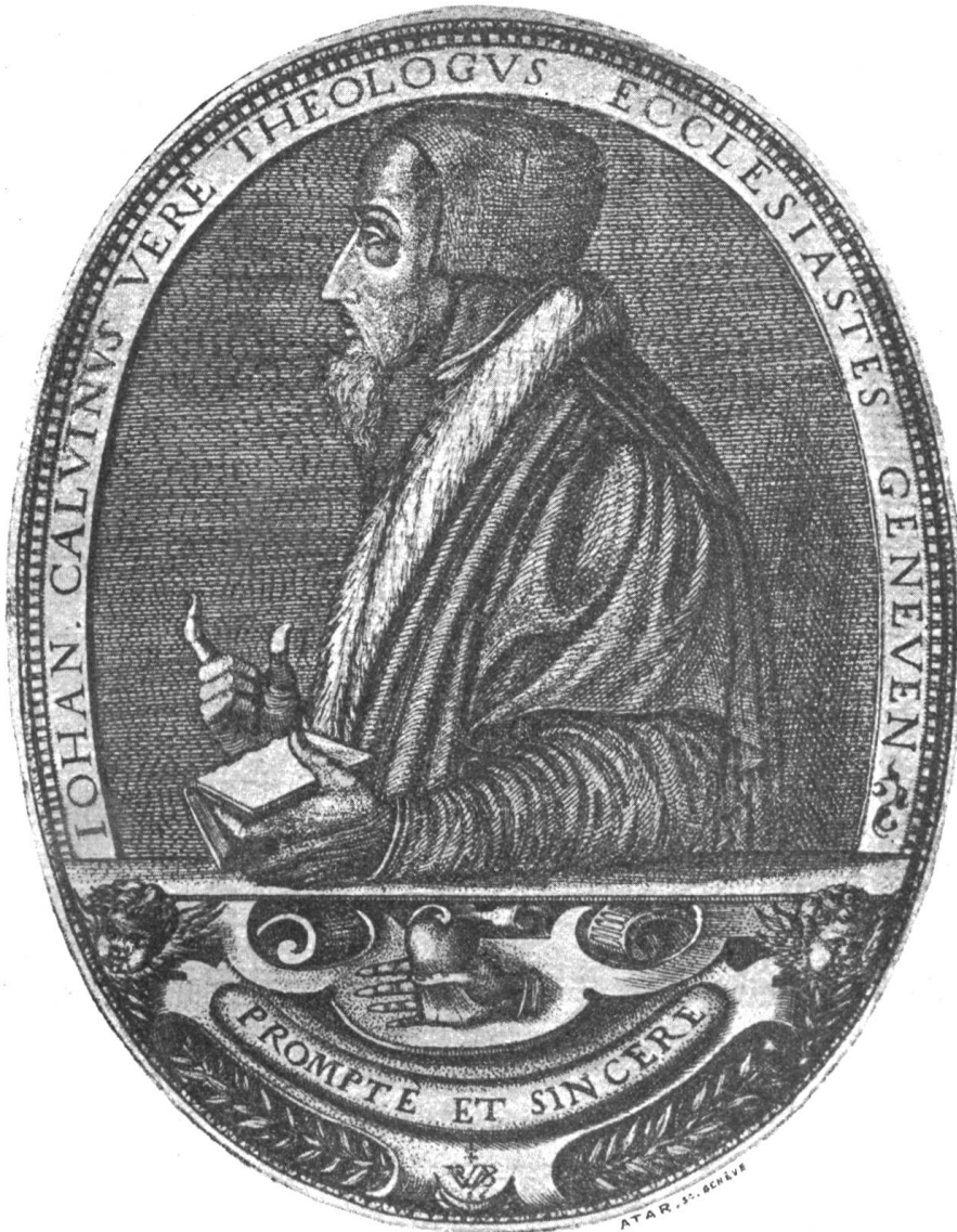
fig. 21. Jean Calvin (gravé par Pierre Weiriot).