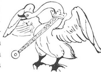
Fig. 37. Ordenszeichen des Schwanes und des Zopfes.