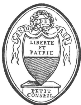
Fig. 39 Sceau du Petit Conseil en 1803

couleur verte devenue populaire, mais à la devise qui évoquait avec trop d'insistance le souvenir de l'invasion française, on substitua celle de Liberté et Patrie . Pour que ces mots fussent bien en vue, on laissa en blanc la partie supérieure de l'écu et ils y furent inscrits d'abord en lettres noires et plus tard en lettres d'or .