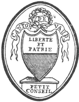
Fig. 39 Sceau du Petit Conseil en 1803

couleur verte devenue populaire, mais à la devise qui évoquait avec trop d'insistance le souvenir de l'invasion française, on substitua celle de Liberté et Patrie . Pour que ces mots fussent bien en vue, on laissa en blanc la partie supérieure de l'écu et ils y furent inscrits d'abord en lettres noires et plus tard en lettres d'or .