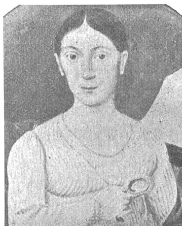
Fig. 65 (voir p. 111) MARGHERITA PEDROTTI 1787—1859

ALBERTO ANGELO ENRICO TURCHI né le 28 mars 1862 et mort le 11 septembre 1884.