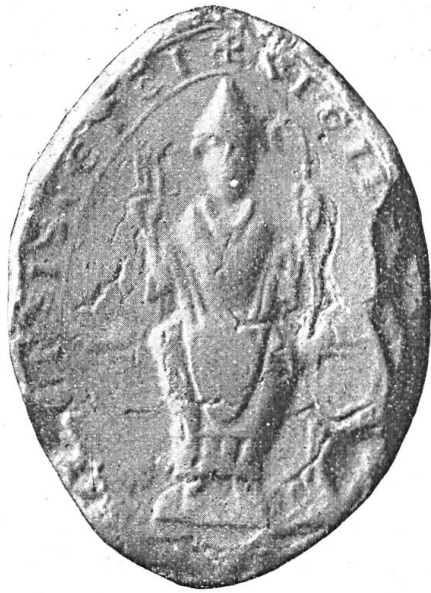
Fig. 19. Siegel des Hugo von Hasenburg, Bischof von Basel.

Für diese Zeit stehen uns nun zwei Bischöfe des Namens H. zur Verfügung, nämlich Hugo von Hasenburg, der 1176 und 1177 den Bischofsitz inne hatte und Heinrich von Horburg, der von 1180 bis 1189 als Bischof vorkommt. Trouillat entschied sich für den zweiten und setzte die Urkunde ins Jahr 1181 (vgl. Monuments de l'histoire de l'ancien évêché de Bâle , Bd. II p. 22). Da aber Heinrich von Horburg ein anderes Siegel führte, wie uns die Abbildung dieses im Basler Urkundenbuch (Bd. I, Siegeltafel I, No. 1) beweist, so ist man wohl gezwungen, das uns vorliegende Siegel dem Hugo von Hasenburg zuzuschreiben.