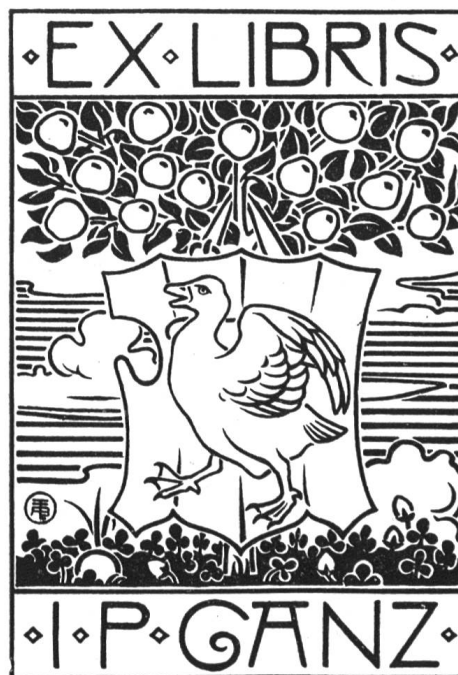
Archives héraldiques suisses, 1898, No. 2.