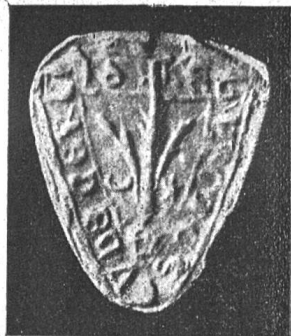
Siegel von Erlach.

Ein Fragment dieses ersten Siegels von Erlach hängt nun an einer Urkunde des Stadtarchivs Neuenstadt, deren Doppel (der Stadt Erlach gehörend) für den Abdruck in Bd. VII, p. 345 der Fontes R. B. gedient hat. Das Stück ist datirt vom Mai 1348. Einen vollständigen Abdruck vom nämlichen Stempel liefert uns eine Urkunde des Bieler Stadtarchivs vom 23. Nov. 1416, worin sich die Städte Biel, Neuenstadt, Erlach, Landern für eine Schuld des Grafen von Neuenburg verbürgten. Das Siegel dessen Abbildung beiliegt, hat dreieckige Form und weist als Siegelbild einen entwurzelten Baum (Erle), begleitet von einem Monde (links) und einem Sterne (rechts). Die Spitze des Baumes reicht in das Kreuz der Umschrift hinein. Die Darstellung des Baumes ist äusserst mangelhaft. Die Legende lautet: