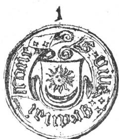
ARMES DE LA VILLE DE GRANDSON.