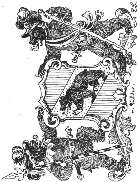
Armes de Berne.