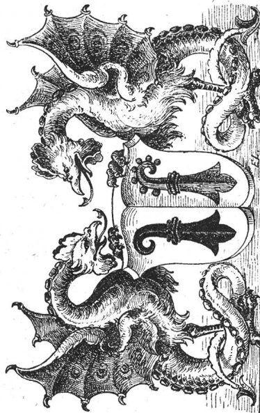
Armes de Bâle.