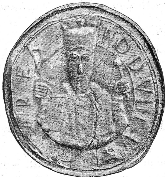
Sceau de Rodolphe III, roi de Bourgogne.

de Saint-Maurice ; c'est probablement d'après ce dernier que M. le D r Morel a pu relever l'empreinte qui nous a permis de reproduire ce sceau intéressant d'une façon plus exacte au moyen de l'autotypie.