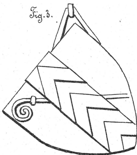
W. des Bischofs Heinrich III von Neuenburg. 1262 - 1274.