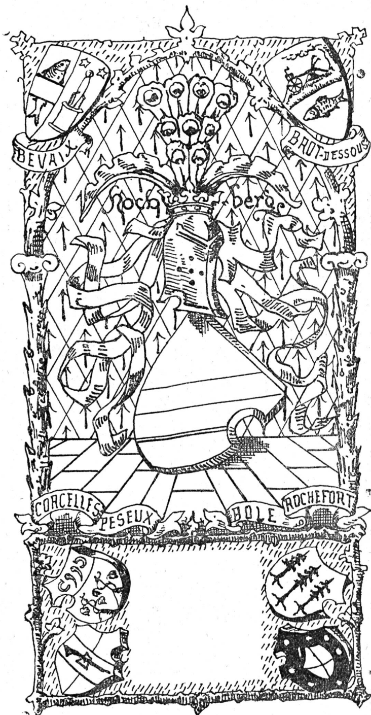
Fig. 442. — Les armes de Bade-Hochberg.

Ce calendrier renferme la série des armoiries communales y compris celles en projet; les plus importantes sont en outre celles des Maisons qui ont régné sur le pays, ainsi que celles de la République.