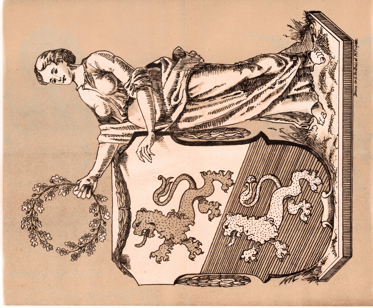
ARMOIRES DU CANTON DE THURGOVIE