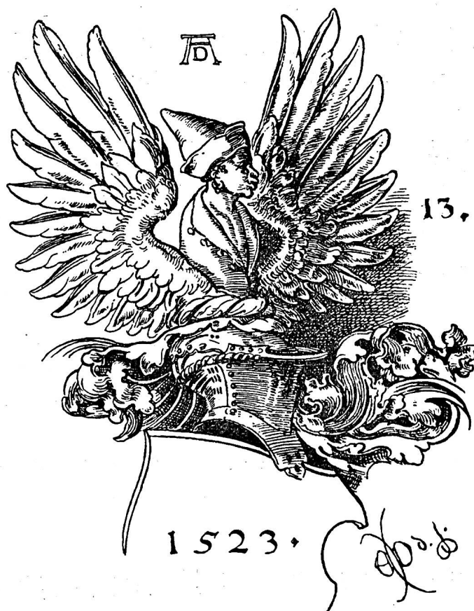
Fig. 315. Casque et cimier, d'après Albert Durer.

Le dessin N° 13, du XVI e siècle, offre l'aspect et les proportions normales de l'écu, du casque et de son cimier. Le buste d'homme est fréquent dans les armoiries et il est ordinairement habillé aux couleurs de l'écu. On appelle vol les deux ailes d'un oiseau jointes ensemble, dont les extrémités s'étendent vers le haut, l'une à dextre, l'autre à senestre. Les lambrequins entourent le casque pour le protéger de l'ardeur du soleil et directement au-dessus se trouve le bourrelet d'où prend naissance le cimier.