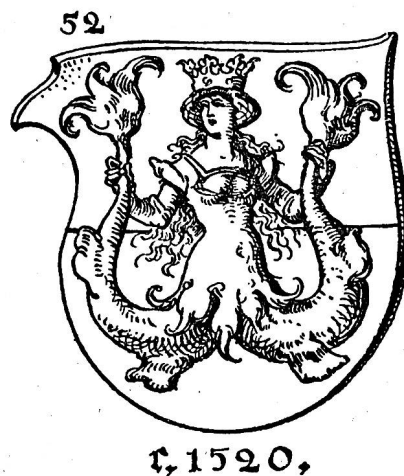
Fig. 317. Une Mélusine, d'après Albert Durer.

Le bourrelet est souvent remplacé par une couronne, comme dans le N o 35. Cette couronne, Helmkrone des Allemands, n'indique aucun rang nobiliaire, mais sert à fixer le cimier sur le casque. Le cimier que donne ce dessin est un dextrochère ; le dextrochère est le bras droit représenté nu, armé ou paré, tenant une badelaire, une épée, une fleur, etc.; au dextrochère correspond le senestrochère , ou bras gauche.