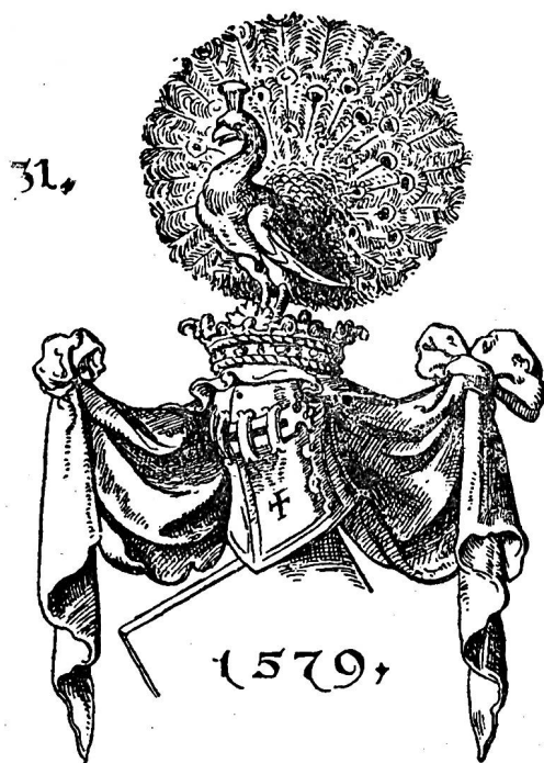
Fig. 318. Un paon, d'après Jöst Amman.

La Mélusine ou Sirène est un monstre fabuleux que tous les peintres et les sculpteurs représentent comme moitié femme et moitié poisson : Desinat in piscem mulier formosa superne . La Sirène est dessinée ayant la tête, les seins, les bras, le corps, jusqu'au nombril, d'une jeune fille, et le reste terminé en queue de poisson, simple ou double. Les Sirènes sont plus fréquentes — dans les armoiries — comme cimiers et supports que comme meubles de l'écu.