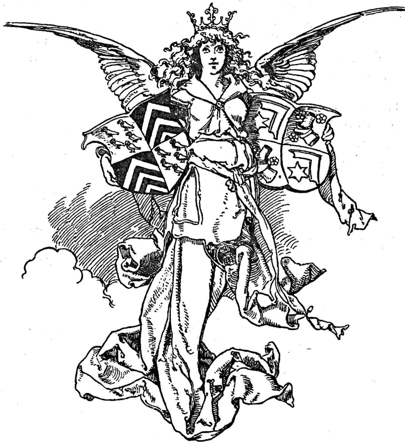
Fig. 319. Groupe héraldique, par E. Döpler. XVI e siècle.