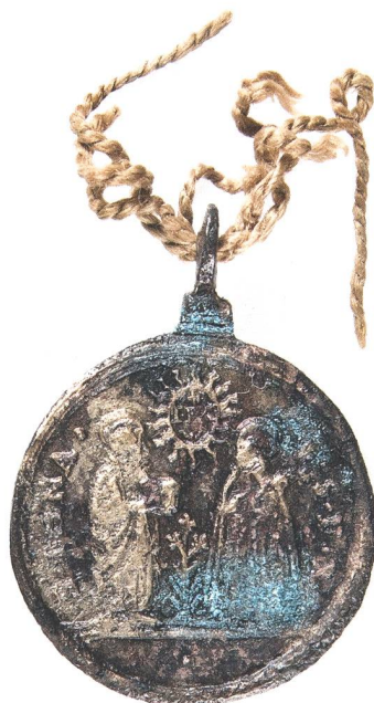
Abb. 11: Rückseite Gnaden- medaille (Objekt B). Mst. 2:1. Fotografie 2010.