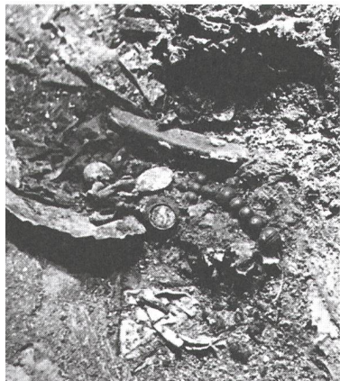
Abb. 2: Chur, Kathedrale St. Mariae Himmelfahrt. Teile des Rosenkranzes in ihrer Fundlage im Jahre 1959.