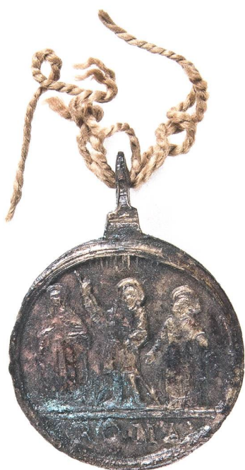
Abb. 10: Vorderseite Gnaden- medaille (Objekt B). Mst. 2:1. Fotografie 2010.