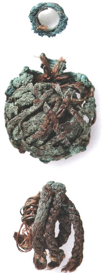
Abb. 14: Die zwei Bestandteile des Posamenterieanhängers mit der abgebrochenen Öse (Objekt D). Mst. 2:1. Fotografie 2010.