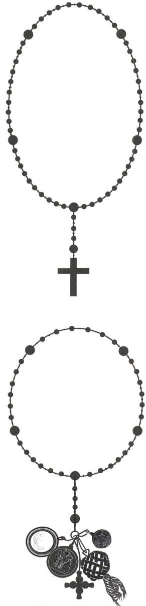
Abb. 5: Schematische Zeichnung eines heute geläufigen Rosenkranzes mit 53 kleinen, sechs grossen Perlen und einem Kreuz. Zeichnung 2012.

Ob der Rosenkranz tatsächlich dem Toten gehört hatte, ist aus archäologischer Sicht nicht zu beantworten. Theoretisch könnte er dem Verstorbenen auch von seinen Bestattern mitgegeben worden sein, weshalb