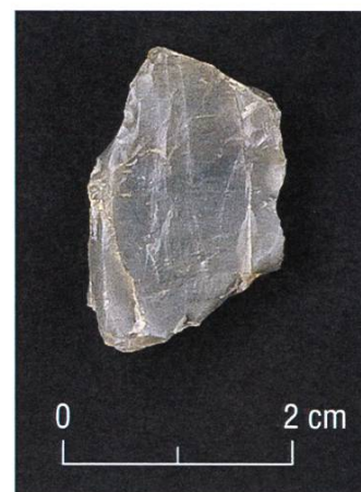
Abb. 3: Galtür, Jamtal, Glierer: Feuerschlagstein (Silex) aus dem Kleingebäude.