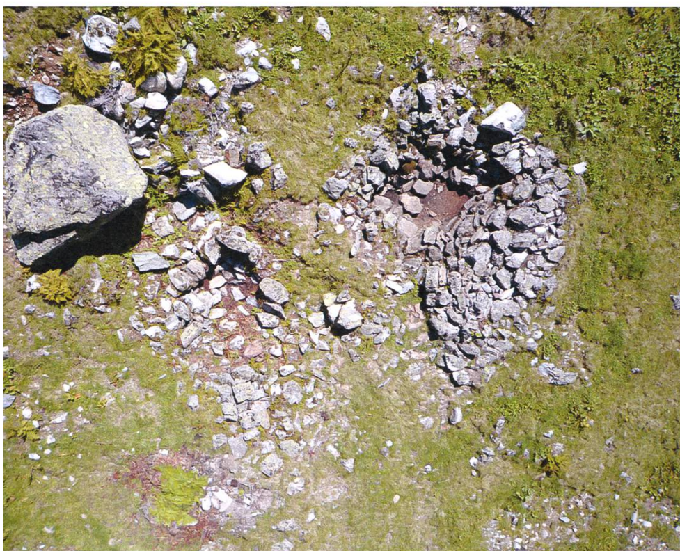
Abb. 1/2: Galtür, Jamtal, Glierer: Zwei verstürzte, einräumige Kleingebäude (Milch-/Käsekeller) mit Feuerstelle, Hochmittelalter. Dokumentation mittels ferngesteuerter Drohne, Sommer 2009 (Grafik: T. Erdin).