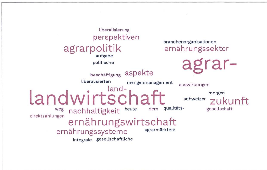
Abbildung 4: Word Cloud der SGA-Tagungsthemen 1998–2023.