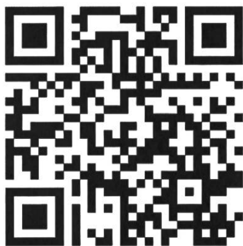
Abbildung 1: QR code zu den SGA-Jahrbüchern auf e-periodica.

Mit dem SGA-Jahrbuch 2014 wurde das auch heute noch gültige Format eingeführt. Dieses beinhaltet neben «Ein Bild sagt mehr» und den Beiträgen der SGA-Nachwuchspreisträger/-innen, einen längeren Fachartikel, ein Interview und die Rundschau. Die Rundschau gibt einen Überblick über relevante Projekte der verschiedenen Institutionen und Organisationen, die in den Fachgebieten Agrarwirtschaft und Agrarsoziologie arbeiten. Das SGA-Jahrbuch trägt damit zum Austausch und Weiterentwicklung von Wissen in diesen Fachgebieten bei.