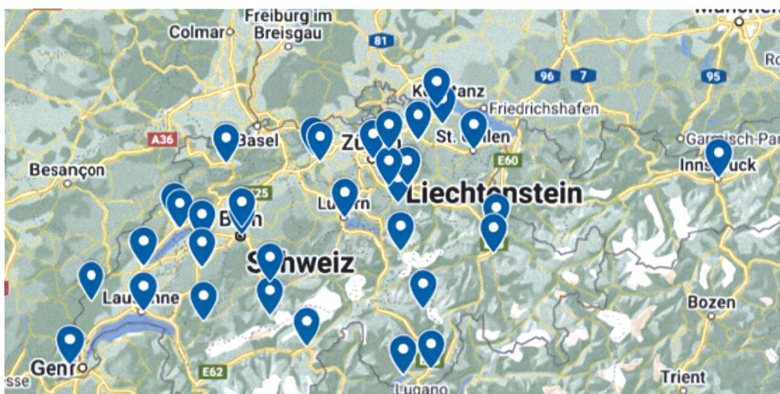
Abbildung 1: Austragungsorte der SGA-Jahrestagungen 1973–2023.

Abbildung 2–4 fassen die Tagungsthemen in einer Word Cloud zusammen. Es zeigen sich klare Muster zu Themen, aber auch spannende Unterschiede zwischen den Themen der ersten und zweiten 25 Jahre (Abbildungen 3 und 4).