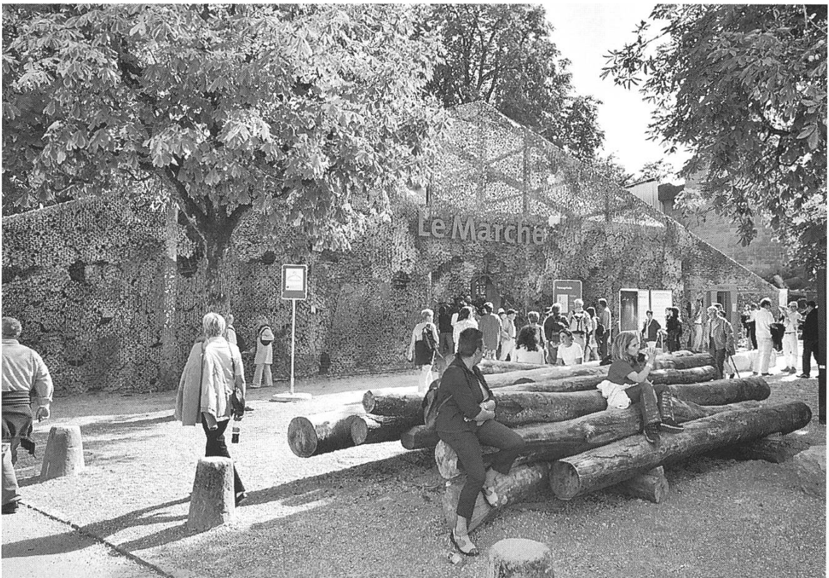
Bild 20: Le Marché Aussenfassade. 16 Messestände mit Spezialitäten der Schweizer Landwirtschaft in einer transparenten und luftigen Zeltstruktur.