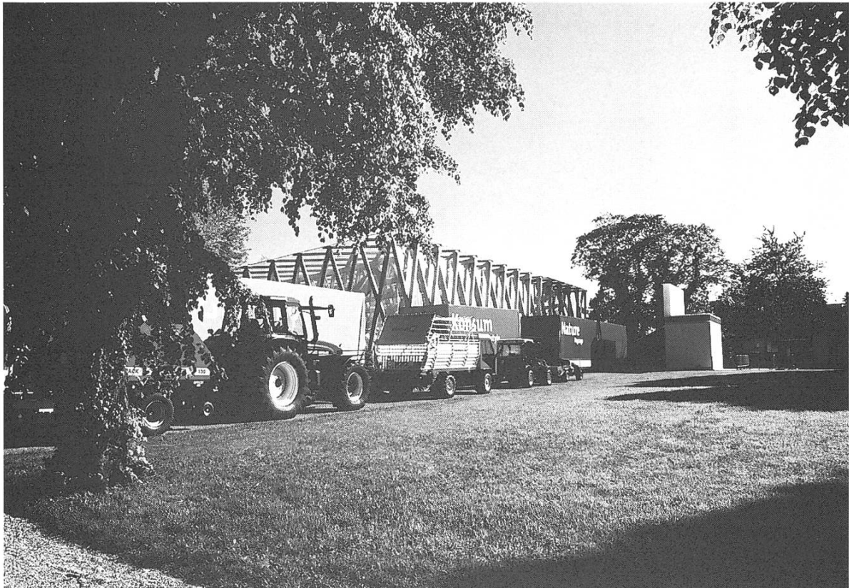
Bild 1: Route Agricole. Maschinen und Motoren: Eine konkrete Folge der Modernisierung des Agrarsektors in einer Industriegesellschaft.