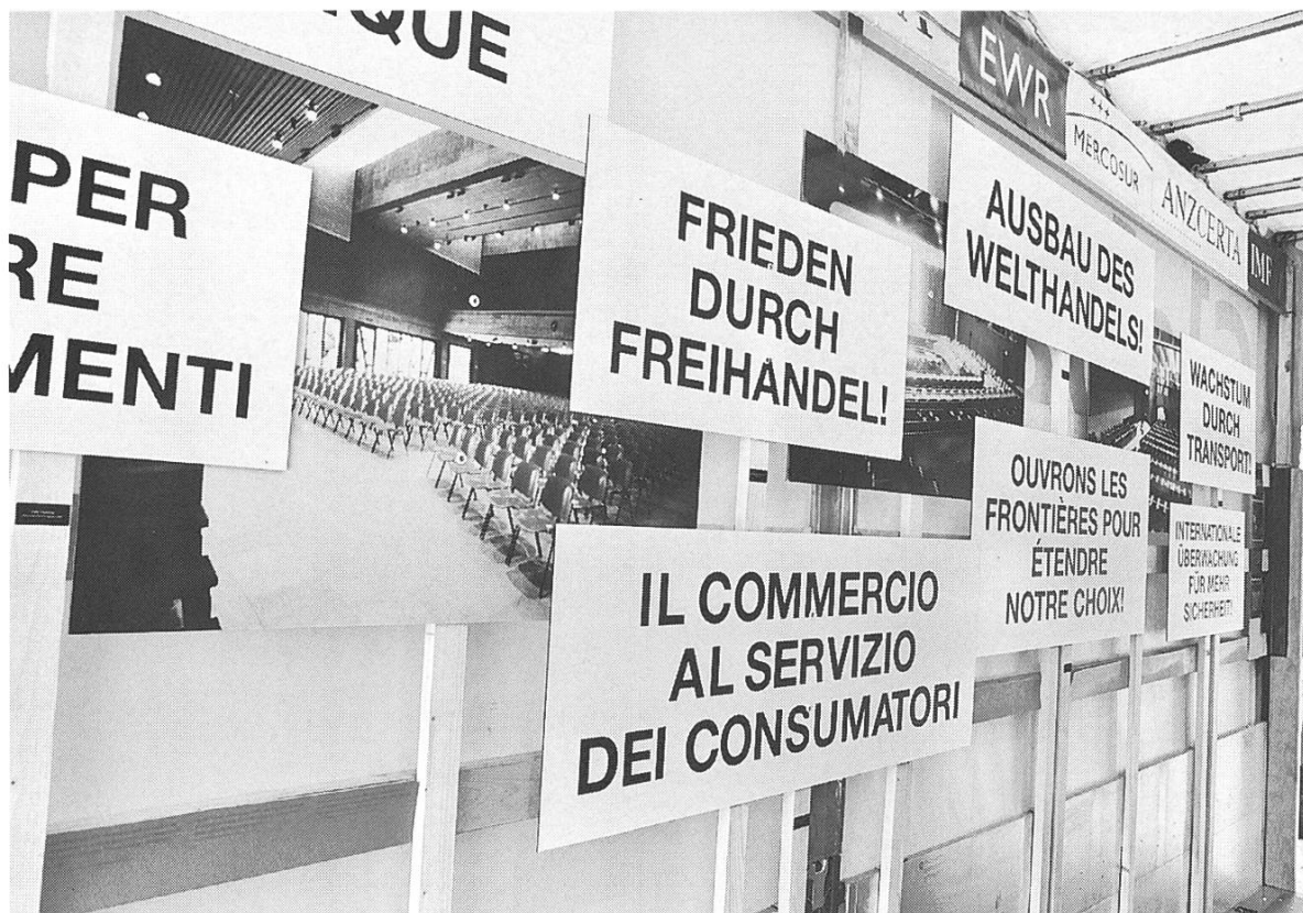
Bild 3: Route Agricole Wagen 4 "Global". Im Zentrum der Aufmerksamkeit: Die Verheissungen des Welthandels.