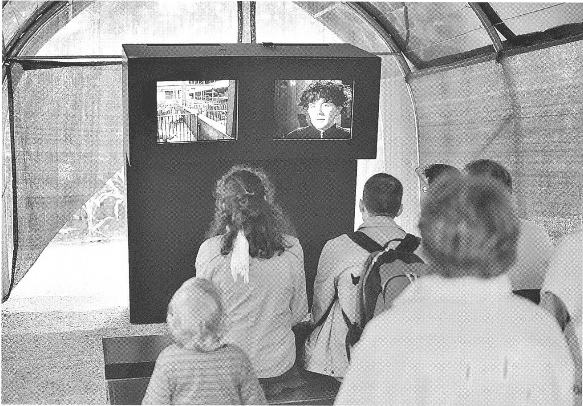
Bild 9: Schauplatz 3 im Jardin des Cultures. Bauernkultur existiert und unterscheidet sich von unreflektierter Folklore.