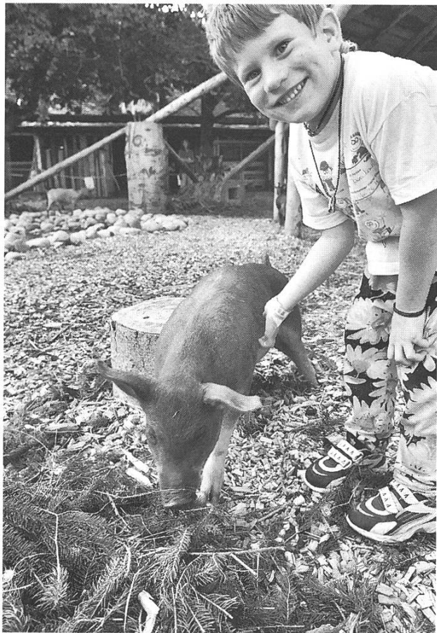
Bild 16: Ferme des Enfants im Jardin des Animaux. Kontakt mit Kleintieren im 20-Minuten-Takt.