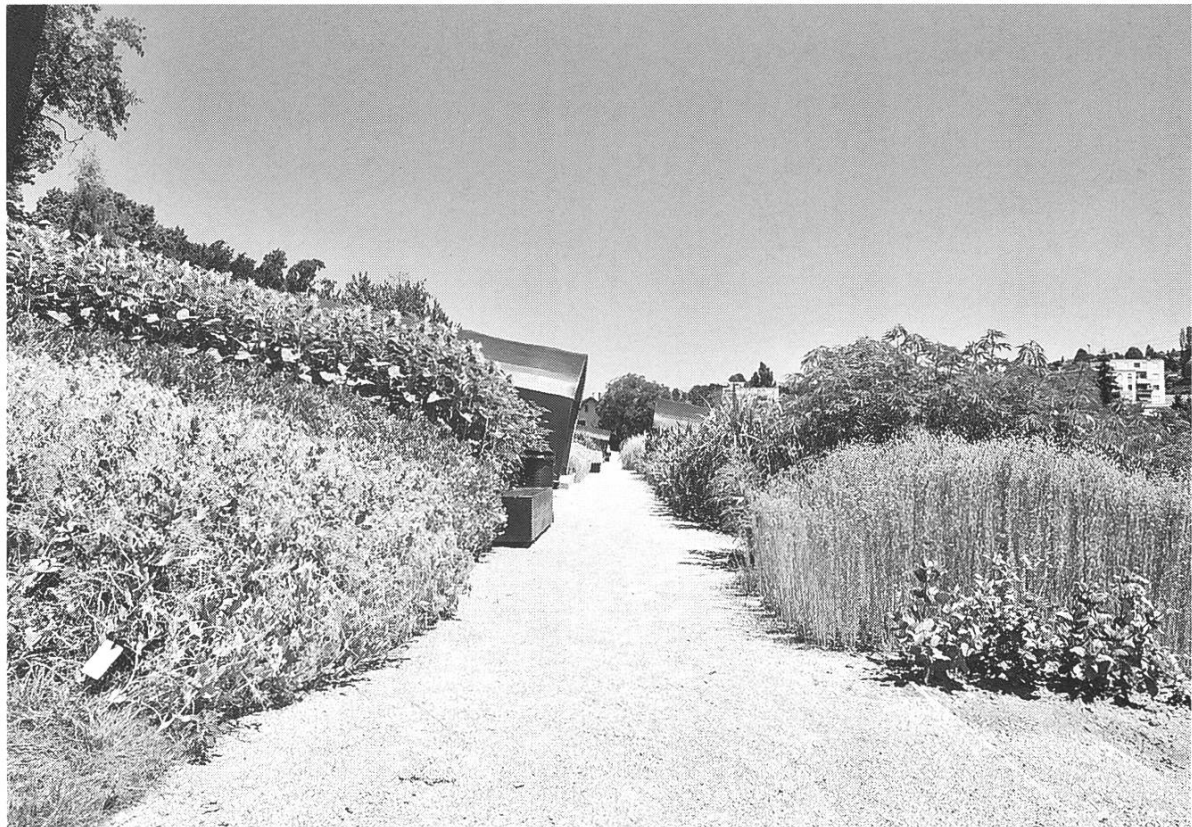
Bild 8: Mittelweg im Jardin des Cultures. Der Ackerbau: Auch eine ästhetisch-ökologische Alternative zur Vergrasung der Schweiz.