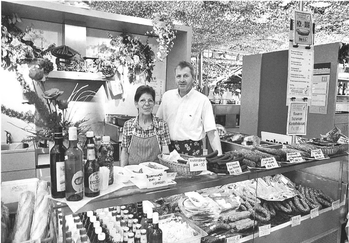
Bild 19: Le Marché Marktstand. Warenhaus oder Wochenmarkt: Der Verkauf von Lebensmitteln als Frage der Oberfläche.