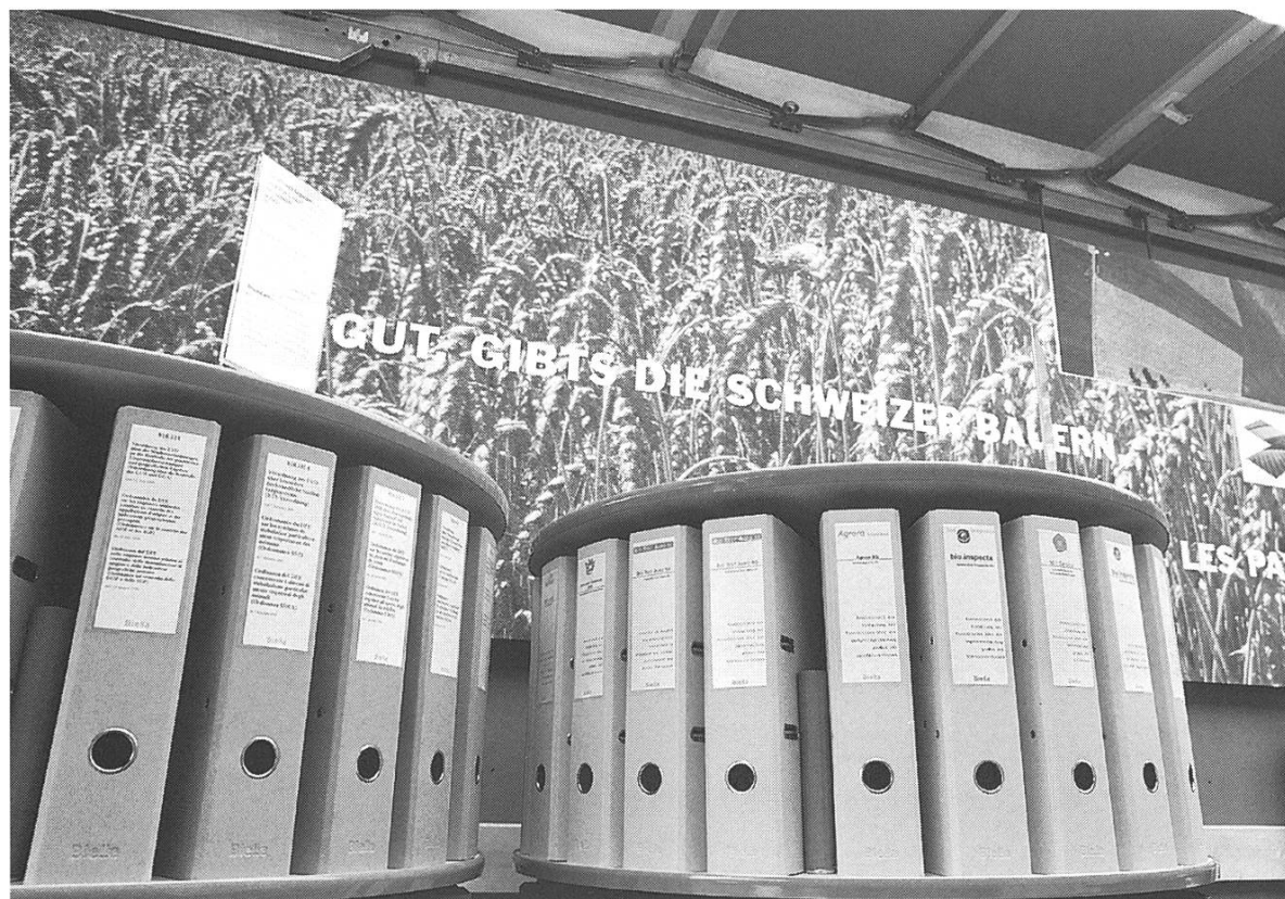
Bild 4: Route Agricole Wagen 7 "Politique agricole". Politik als Ritual – Agrarpolitik im Spannungsfeld zwischen Absicht und Auswirkung.