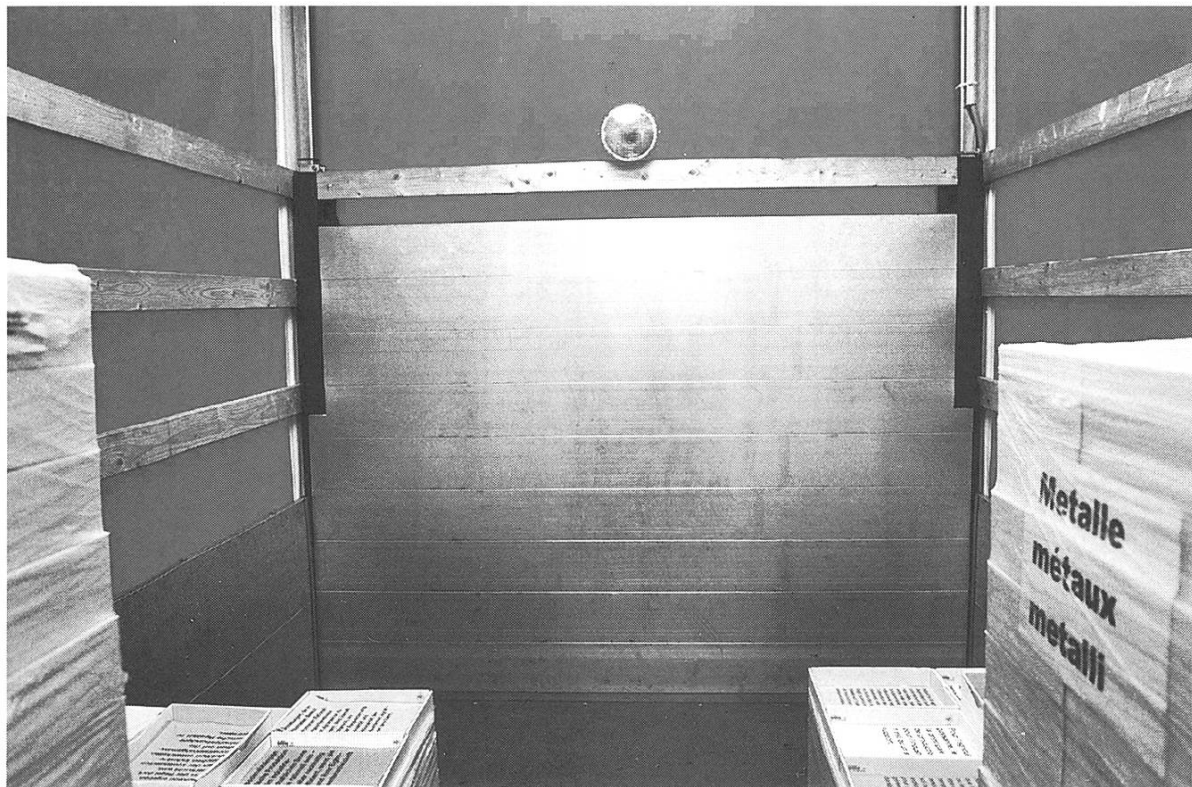
Bild 6: Route Agricole Wagen 9 "Ressourcen Potentials/Limits". Wer nicht zurückblickt, findet den Ausweg nicht. Eine Analyse der grundlegenden Ursachen, weshalb die bäuerliche Landwirtschaft mit der Industrialisierung der Ernährung in die Sackgasse geriet.