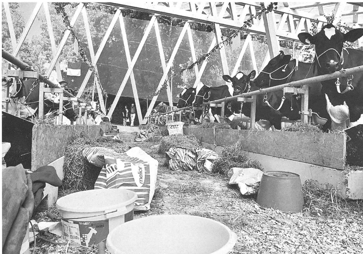
Bild 12: Forum Arena Viehschau. Milch und Fleisch aus Gras und Kraftfutter: Hochleistungsvieh als fragiler Erfolg der Agrarindustrie.