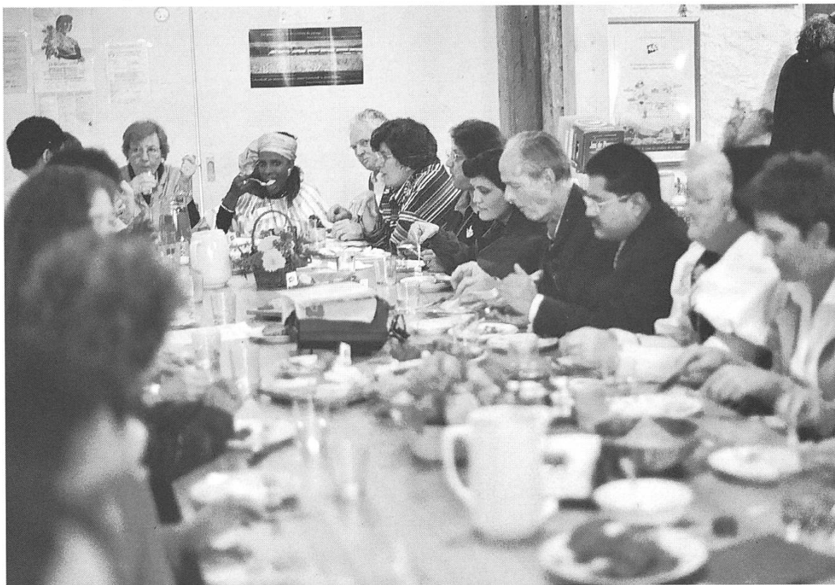
Bild 14: Ferme des Enfants im Coin des délices. Lokaltermin in der Bauernküche am internationalen Tag der Landfrauen.