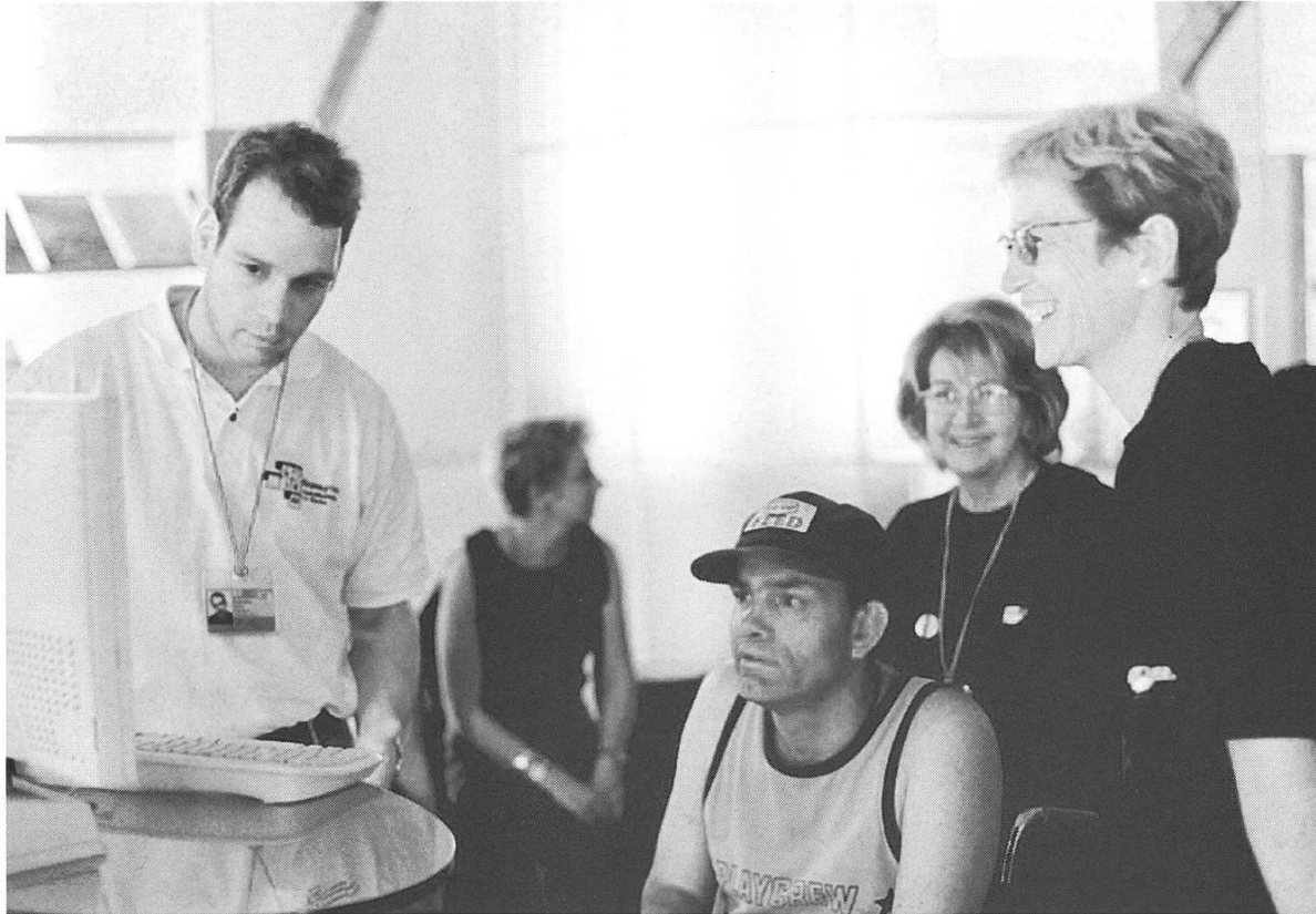
Bild 17: Infopool. Die Expoagricole als Gelegenheit zur Informationsbeschaffung über die Landwirtschaft.