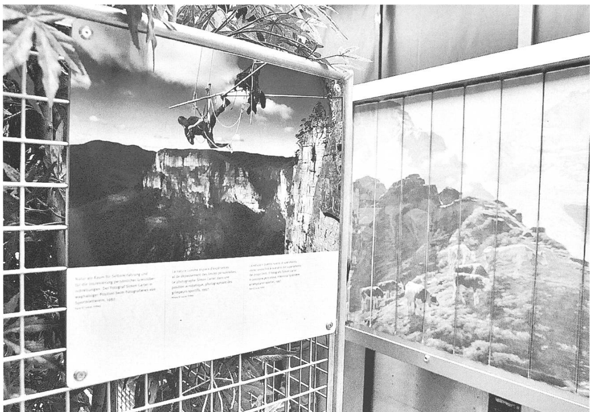
Bild 2: Route Agricole Wagen 1 "Nature". Vom Bedeutungsverlust der Landwirtschaft: Natur ist (auch) das, was sich die Menschen darunter vorstellen.