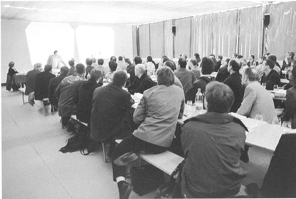
Bild 13: Forum Mehrzwecksaal Tagung SGA/SVIAL. Die Agrarwissenschaften im Spannungsfeld zwischen Wissen schaffen und Beraten.