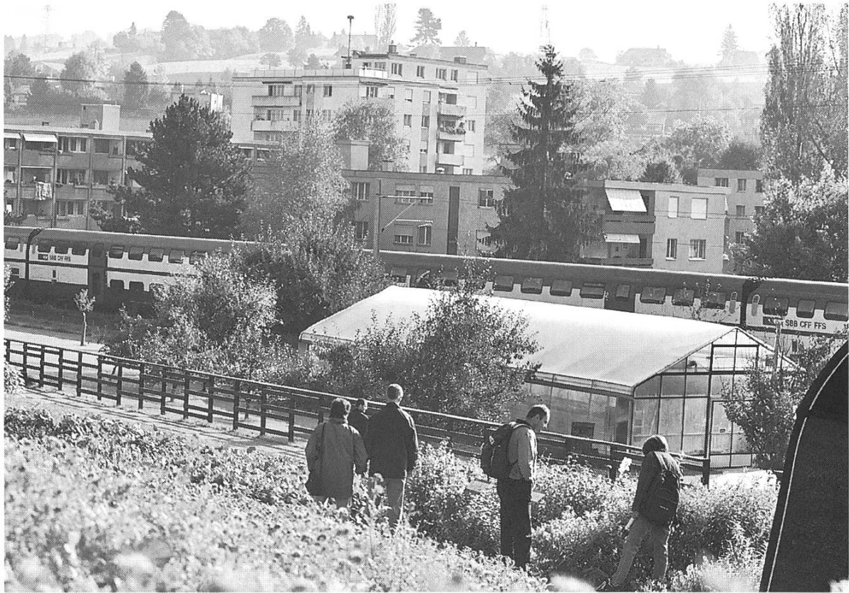
Bild 7: Jardin des Cultures und Umgebung. Kann die Verdrängung der Landwirtschaft aus der Fläche mit Hors-Sol-Anlagen aufgefangen werden?