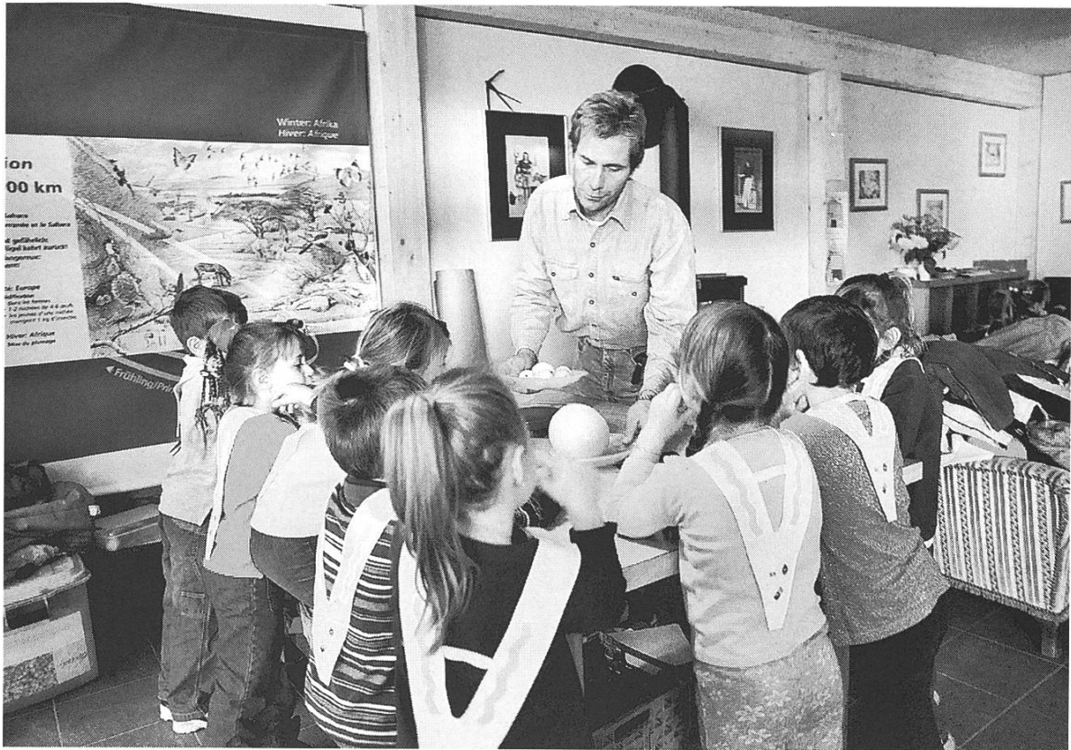
Bild 15: Ferme des Enfants beim Aventure à la Ferme. Was die Kinder über Landwirtschaft und Ernährung wissen sollten.