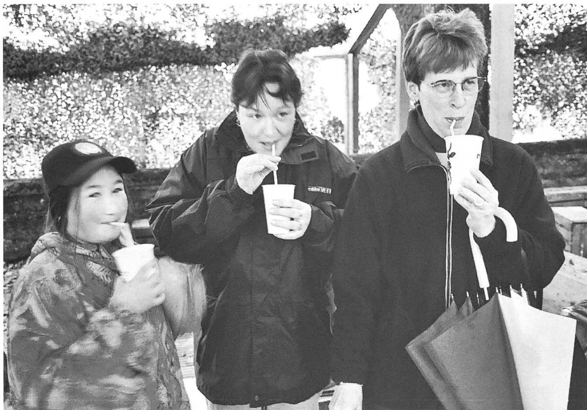
Bild 18: Le Marché Besucherinnen. Moderner Konsum: Der weite Weg zum nächsten Glas Rohmilch.