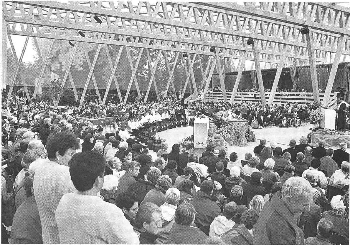
Bild 10: Forum Arena Erntedank. Das Forum: Der Rahmen für mehr als 80 Veranstaltungen, Versammlungen und Tagungen während 160 Tagen.