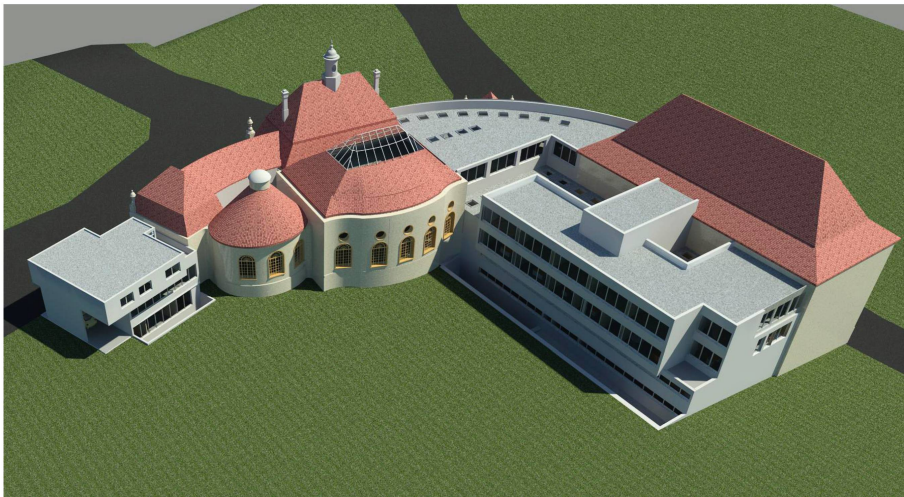
Modèle de la BCU après la transformation 1970-1975.

Romont-retour (6 camions par jour); déménagements principaux de janvier à octobre 2020, y compris une interruption en mars et avril 2020 due à la pandémie Covid-19.