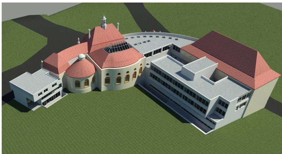
Modèle de la BCU après la transformation 1970-1975.

Romont-retour (6 camions par jour) ; déménagements principaux de janvier à octobre 2020, y compris une interruption en mars et avril 2020 due à la pandémie Covid-19.