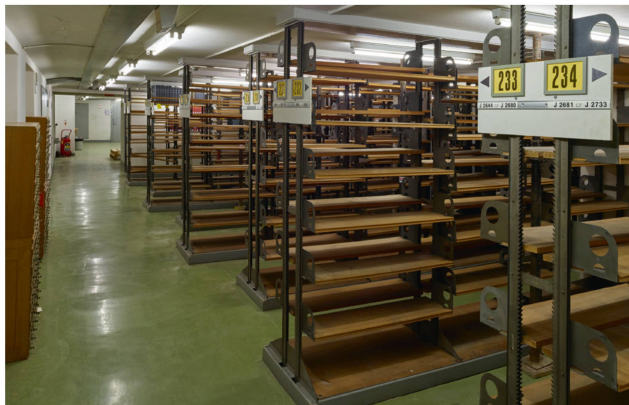
Les anciens magasins de la BCU après l'évacuation des livres.

Les attrait de la nouvelle infrastructure, mais également les nombreuses difficultés liées au bâtiment vieillissant ont été largement médiatisés ; les problèmes de stabilité des anciens magasins notamment, et les images des plafonds étayés ont sans doute eu un certain effet.