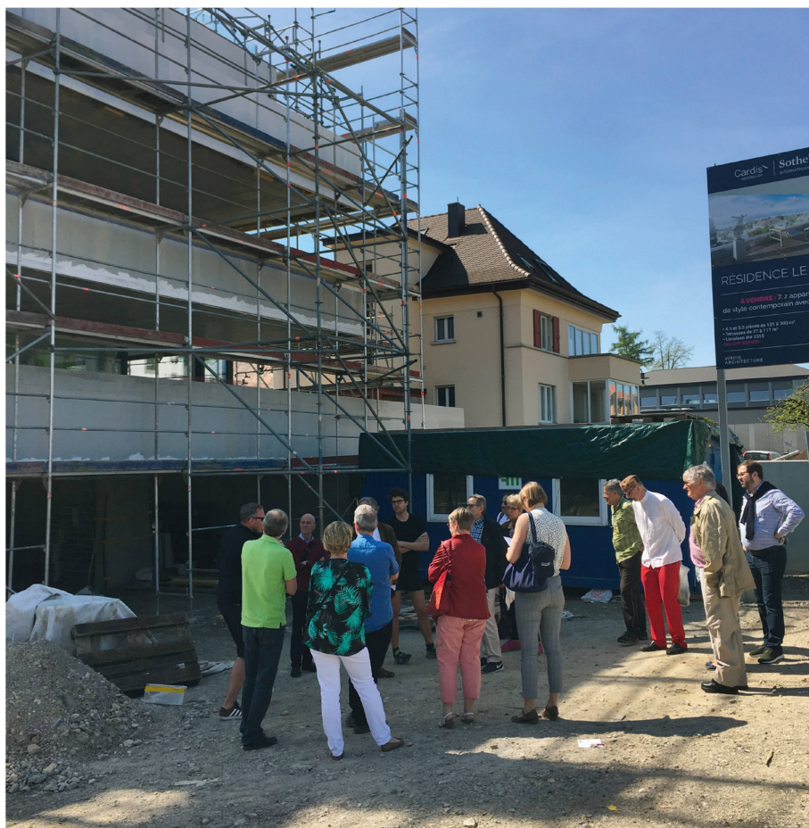
Printemps du patrimoine, visite d'un chantier, Estavayer-le-Lac, 21 avril 2018.