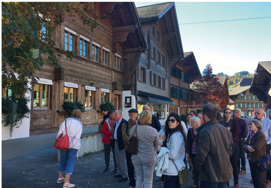
Excursion en Haute-Gruyère, 13 octobre 2018.