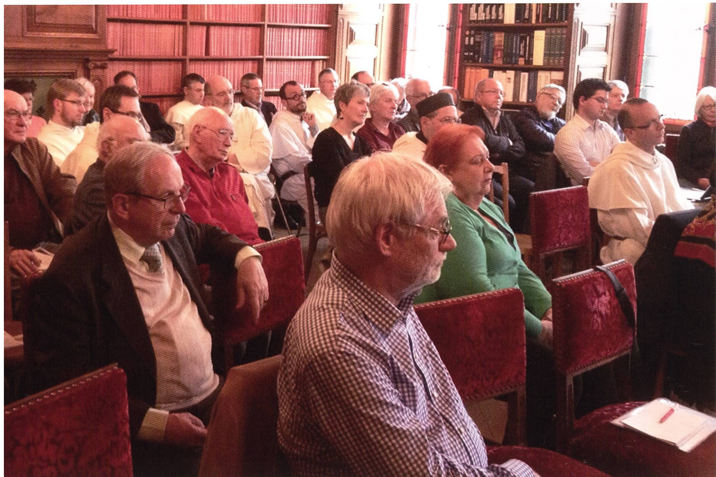
Journée d'étude sur le Chapitre général des Dominicains à Fribourg, 8 avril 2016.