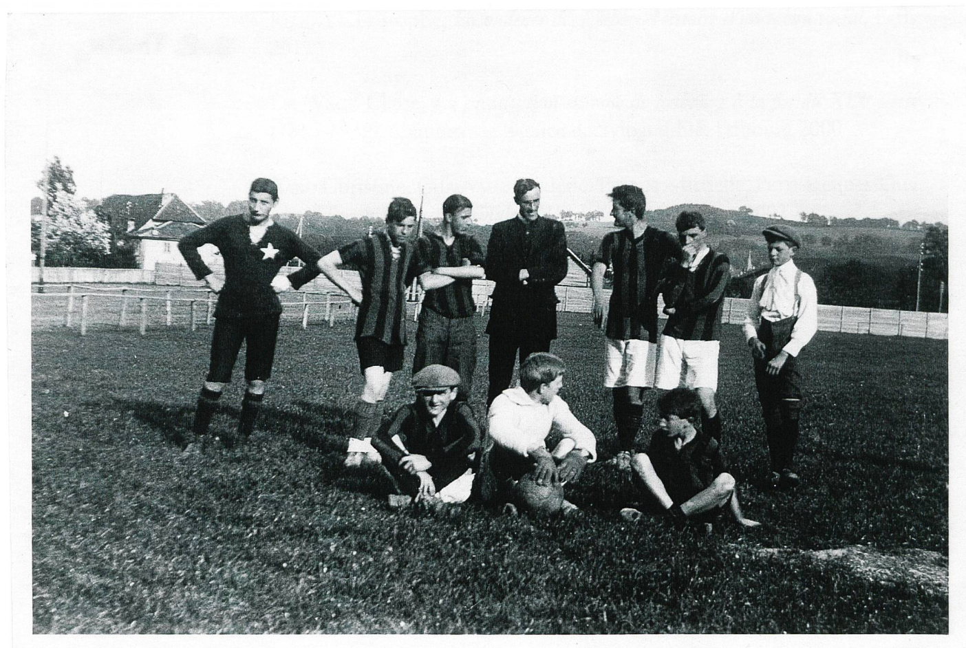
L'«étrange camaraderie» qui liait l'abbé et ses joueurs ne manquait pas de choquer le recteur du collège.