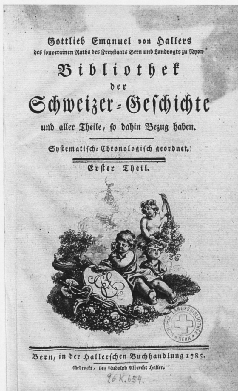
Frontispice de la Bibliothek der Schweizer-Geschichte de Gottlieb Emanuel von Haller, 1785. Berne, Bibliothèque nationale suisse.

LISTE DES PUBLICATIONS 2010-2011 ET NOTES DE LECTURE