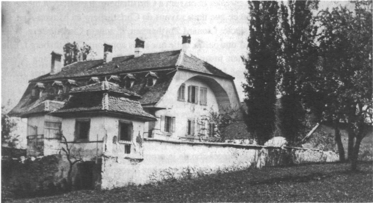
Le château de Christlisberg vers 1900, photo: Léon de Weck, Archives J.B. de Weck, Villars-sur-Marly.