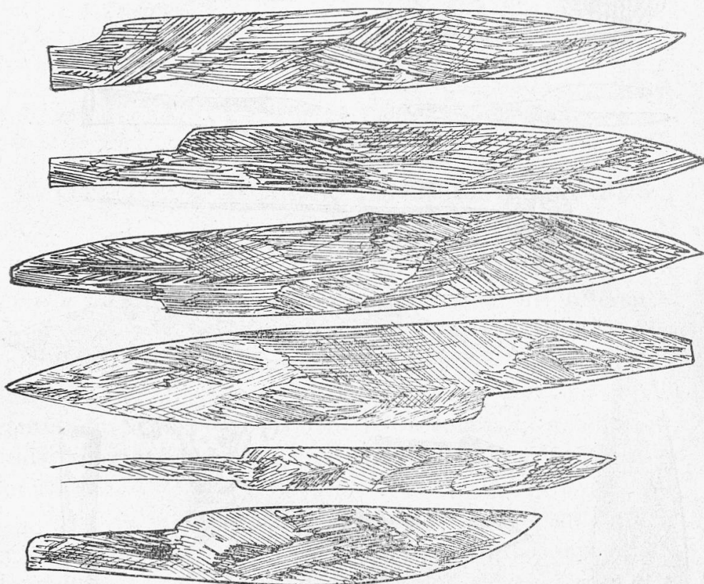
Couteaux romains trouvés aux « Tuiles » de St-Blaise (Collection Ritter).

Nous venons de revivre, en pensée, comme ce sera le cas pour Thielle , une partie de l'époque gallo-romaine , puisque nous sommes au commencement de l'ère chrétienne. Les Helvètes ont abandonné La Tène environ 50 ans avant J.-C. et nous trouvons les Romains au Pont de Thielle depuis l'an 20 après J.-C.