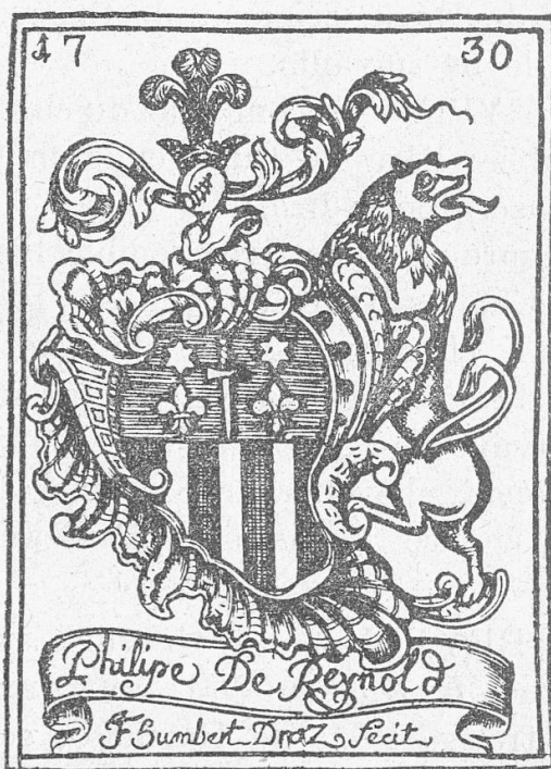
N o 114