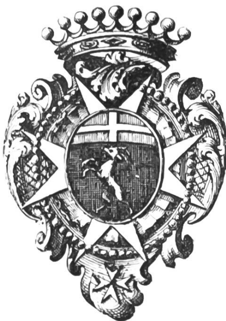
N o 72.