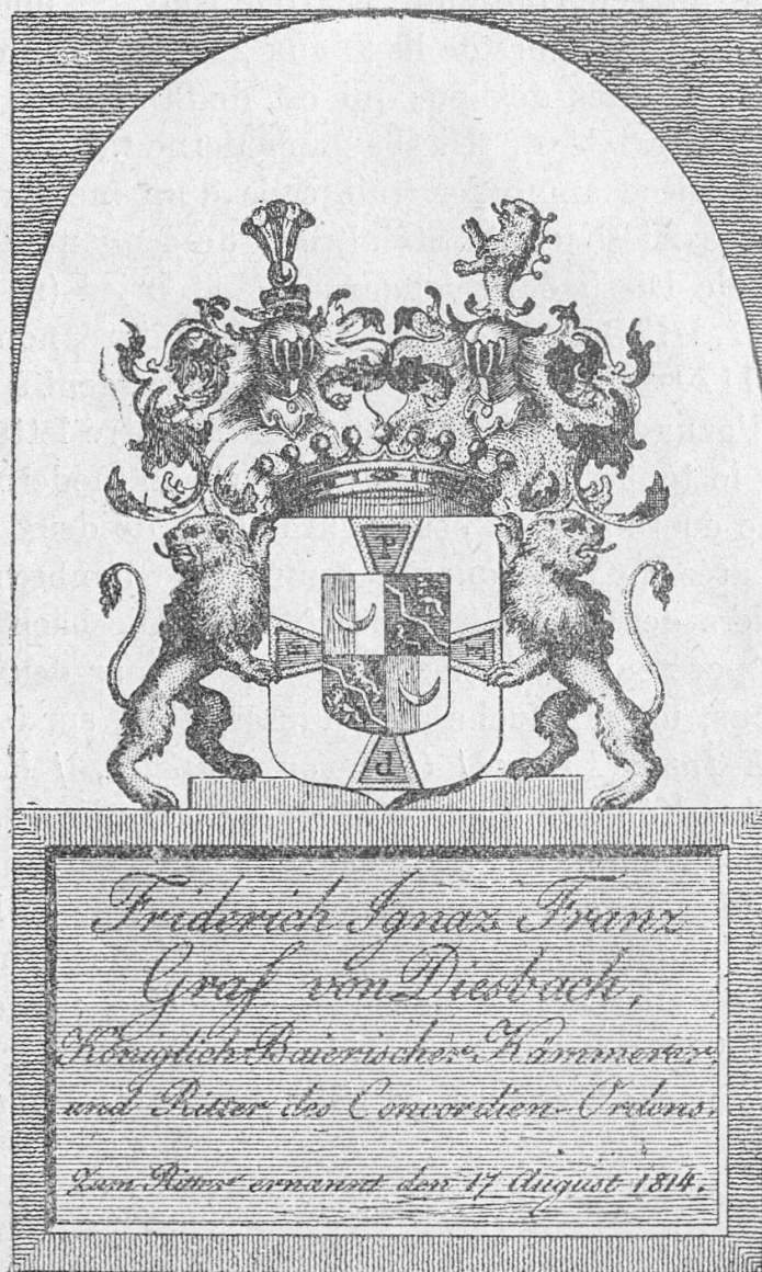
N o 41

Le Chambellan de Diesbach mourut le 1 er août 1852.