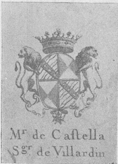
N o 24