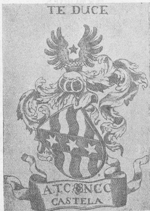
N o 20

N o 21. CASTELLA. -- Gravure sur cuivre, non signée, de 40 × 47 mm . Un cartouche Louis XV, entouré de palmes et de lauriers, est chargé d'un écu d'argent à 3 barres