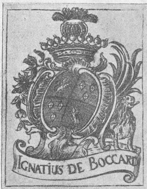
N o 15