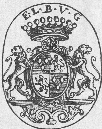
N o 13

N o 13. BOCCARD. — Gravure sur cuivre, non signée, de 41×51 mm. Dans un ovale formé par un filet, les armes de Boccard, sur un cartouche : écartelé d'azur à trois losanges de..., et de... au lion de..., posées sur une console, soutenues par deux lions, et timbrées d'une couronne à 9 boules ; en haut, les initiales E. L. B. V. G. 2