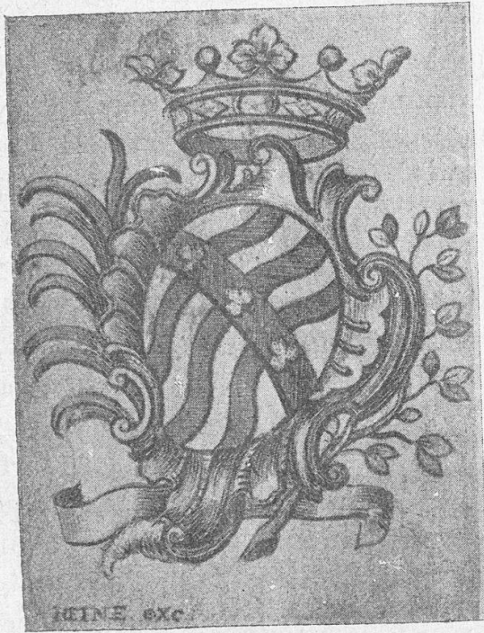
N o 19

N o 19. CASTELLA. — Gravure sur cuivre, signée « Heine exc. », de 51 × 61 mm (51 × 66 signature y compris).