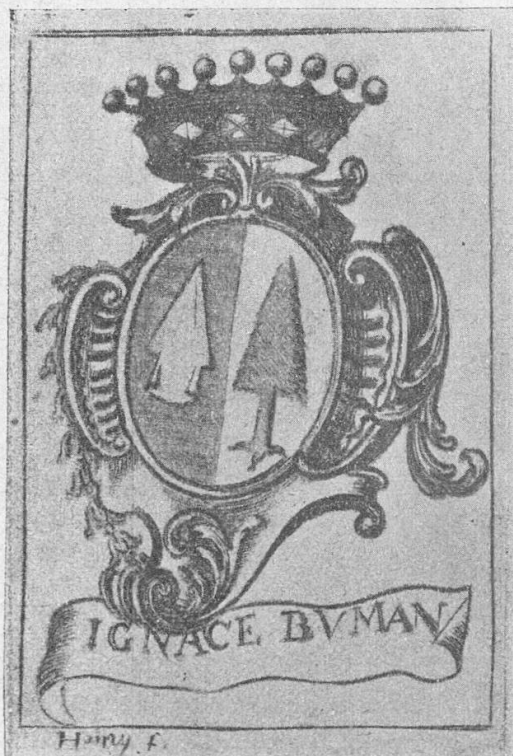
N o 17

quelle sont des plantes et un arbre ; casque grillé, taré de trois quarts, sommé de lambrequins en forme de plumes ; cimier : un buste de femme nue et coiffée d'un tortil dont les bouts flottent ; au bas, une banderole avec le nom : Henri Brünisholtz ; le tout entouré d'un filet.