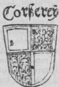
Fig. 19. — Les armoiries de Corserey d'après le plan de Fribourg de Martin Martini. 1606.

La position du bleu et du rouge n'est pas fixe ; sur certains documents on trouve le bleu au premier quartier ; sur d'autres, le rouge.