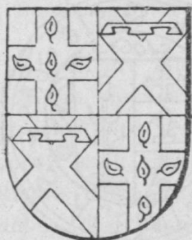
14. De Bruel