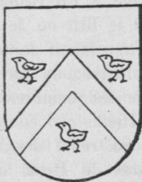
Armes des Rolland