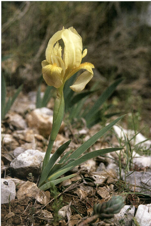
Fig. 2. Iris jaunâtre ( Iris lutescens Lam.) - P. Prunier.