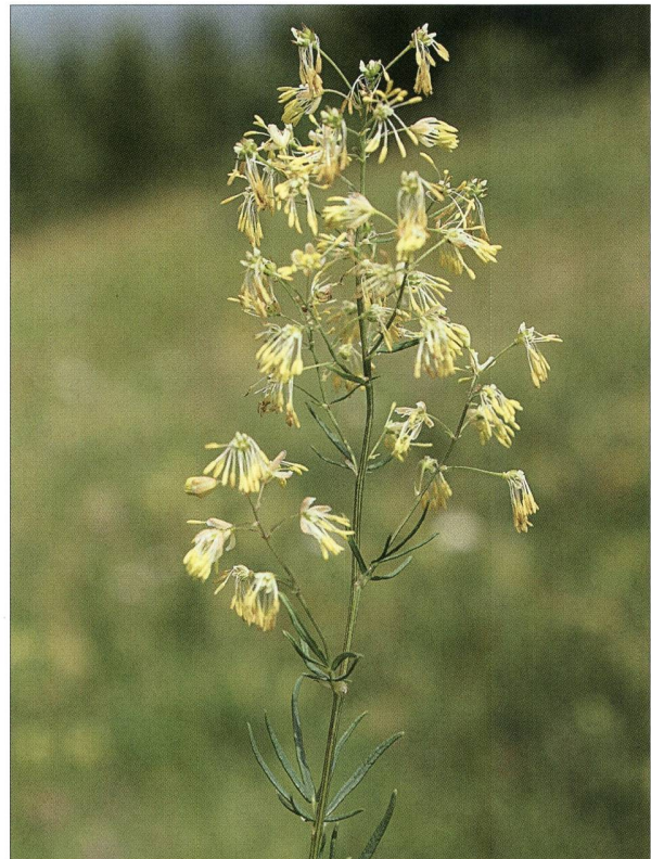
Fig. 8. Pigamon simple ( Thalictrum simplex L.) - P. Prunier.