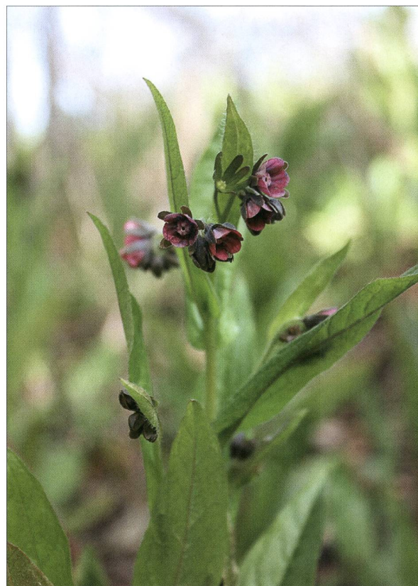
Fig. 1. Cynoglosse d'Allemagne ( Cynoglossum germanicum Jacq.) - P. Prunier.

a. Une dizaine de récoltes : « Rochers d'Archamps » ; « Salève 1 er Piton » ; « Au Piton près Genève » ... entre 1850, J. Muller et 1913, H.A. Romieux.