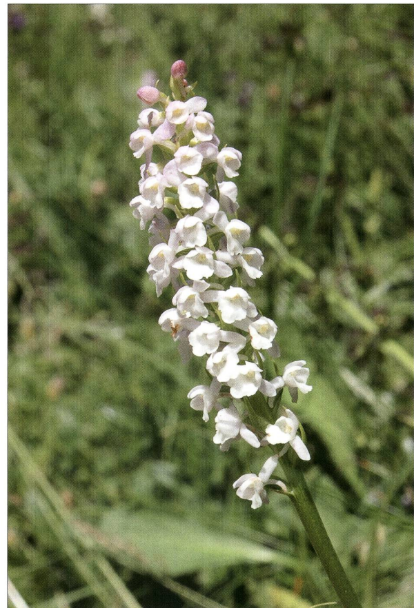
Fig. 6. Gymnadénie odorante ( Gymnadenia odoratissima (L.) Rich.) - P. Prunier.