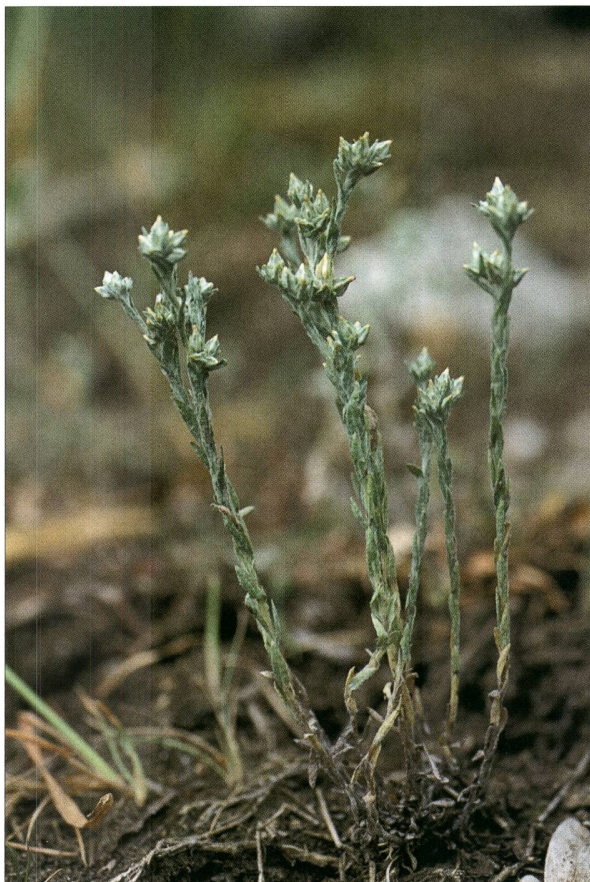
Fig. 5. Cotonnière naine ( Logfia minima (Sm.) Dumort) - P. Prunier.

Statut: Protection R – UICN Rhône-Alpes: LC.