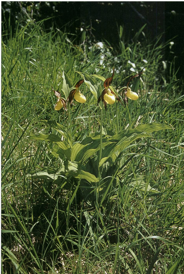
Fig. 4. Sabot de Vénus ( Cypripedium calceolus L.) - P. Prunier.

Statut Protection : R – UICN Rhône-Alpes : LC.