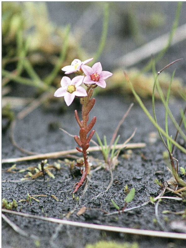
Fig. 7. Orpin velu ( Sedum villosum L.) - P. Prunier.