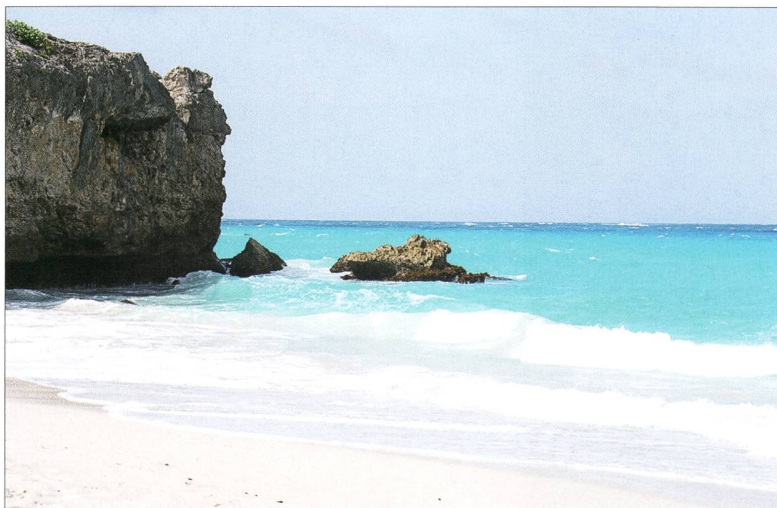
Fig. 4. Plage de Bottom Bay, île de la Barbade.