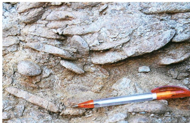
Fig. 3. Affleurement dans la Formation du Vuache. Les galets arrondis et aplatis sont parfois agencés chaotiquement (en bas de la photo), parfois imbriqués (en haut). Le stylo mesure 14 cm.