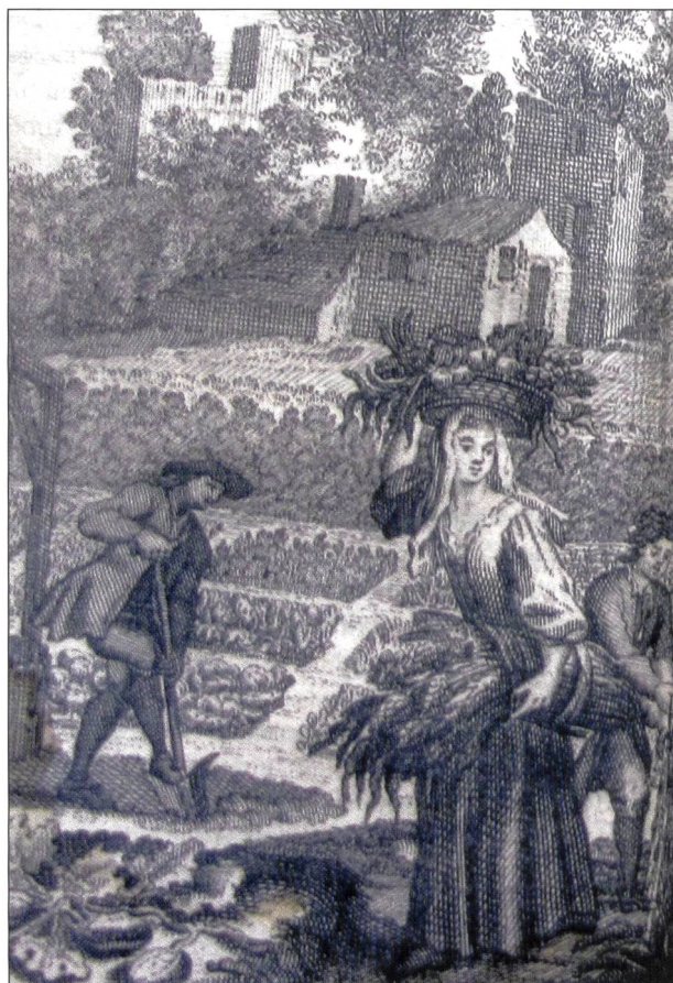
Fig. 4. Récolte de jardinage et d'agriculture, illustration du livre VI portant sur les maladies des arbres du Prædium rusticum de Jacques Vanière, Toulouse, 1730 (Bibliothèque municipale de Reims).

La science chimique, science de cette physiologie et des arts et métiers, science des échanges de matières diverses, semblerait donc bien la mieux adaptée à la prise en compte tout à la fois et à divers niveaux, des différents processus technico-scientifiques et socio-économiques 81 . Pour Stahl, la première « mixtion » est accomplie par le règne végétal et la putréfaction et la combustion libèrent le phlogistique dans l'atmosphère qui est repris par les végétaux 82 . De même pour Baumé, la « végétation est le seul moyen que la Nature emploie pour combiner la plus grande partie du feu élémentaire qui nous vient du Soleil » 83 ; ainsi la première fonction des végétaux est « de combiner immédiatement les quatre éléments, et servir