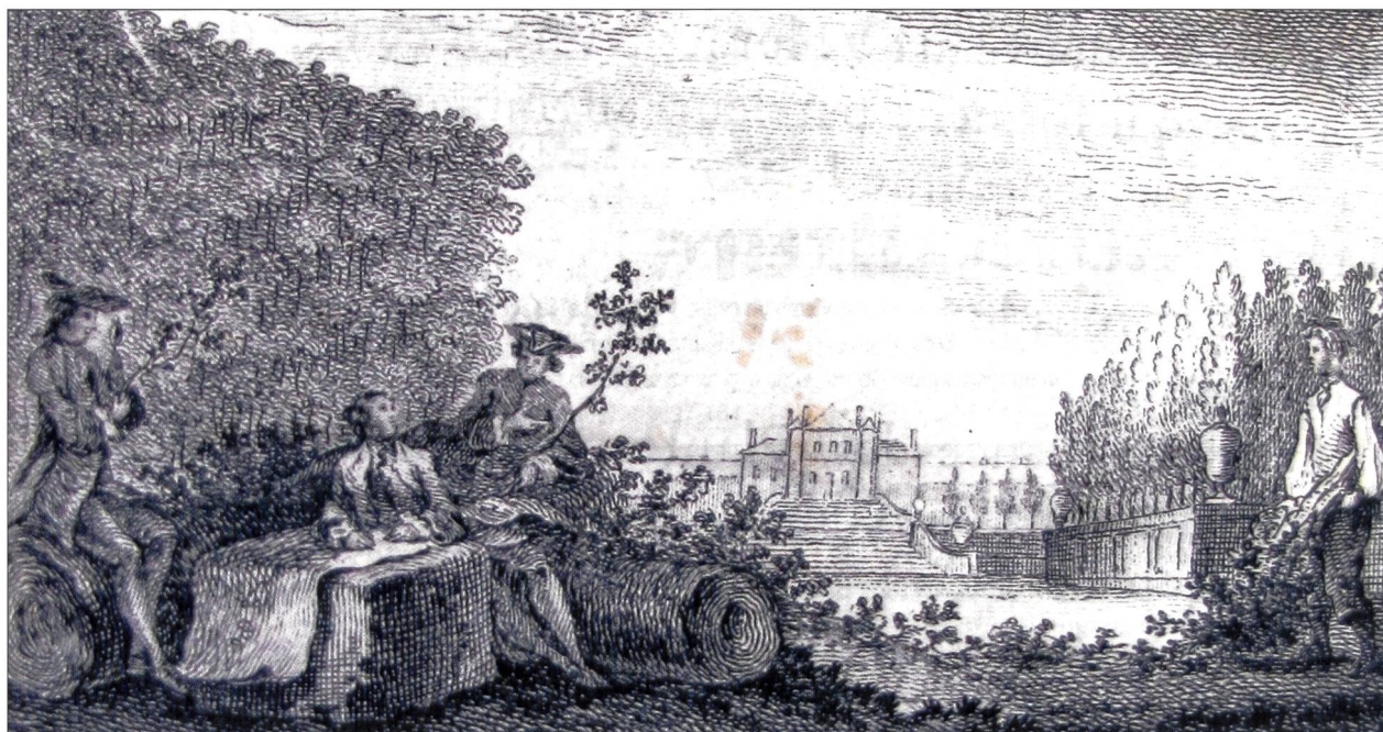
Fig. 1. Le savant et l'agriculture. Vignette ornant la préface de La Physique des arbres de Henri-Louis Duhamel du Monceau, Paris, 1758, vol. 1 (collection privée).

vaux sur les maladies des blés, d'abord au « bien public », avant d'assurer le « progrès de la physique » 3 . Cette mobilisation en faveur de l'amélioration de l'agriculture s'exprime selon deux types de préoccupations, celle liée au « causes morales » surtout de l'école physiocratique, et celle liée aux « causes physiques » des sciences et techniques, qui nous intéresse plus particulièrement ici 4 . Les premières personnes concernées par cette dernière préoccupation sont, jusqu'au milieu du siècle, essentiellement des personnalités rurales, depuis des membres de la noblesse terrienne ou fermiers cultivés jusqu'à des administrateurs locaux que l'on remarque dans les premières sociétés d'agriculture jusque dans les années 1750-1760. Parallèlement à cette mobilisation rurale, un engagement de savants en faveur de l'agriculture va s'exprimer, à partir des années 1750, par l'augmentation du nombre de leurs écrits ayant trait à l'agriculture ou de sujets abordés dans le cadre des académies et périodiques savants, ou encore par un souci d'application à l'agriculture que l'on constate en filigrane de plusieurs écrits savants. A la fin du siècle se dessine ainsi une communauté informelle au contour imprécis, constituée d'auteurs ruraux auxquels se sont joints des savants, botanistes, chimis-