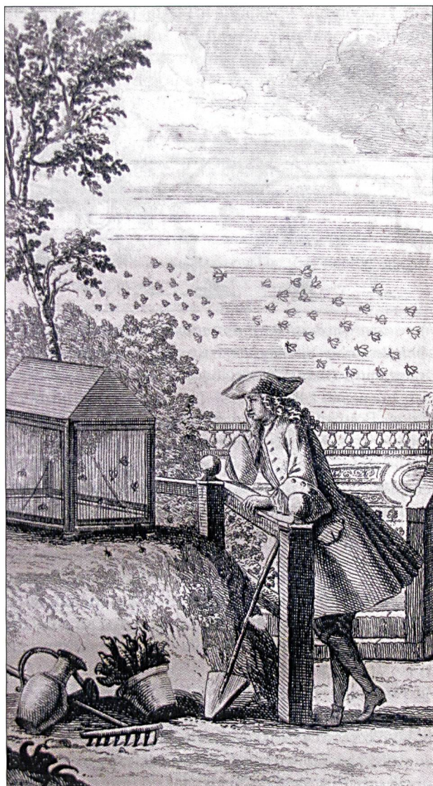
Fig. 2. Le naturaliste et les insectes, illustration du livre XIV portant sur les abeilles du Praedium rusticum de Jacques Vanière, Paris, 1756 (Bibliothèque municipale de Reims).

Le projet est décrit chez Linné dans son Essai sur la culture des végétaux édité dans le Journal Economique d'octobre 1751. Les connaissances pratiques agricoles sont, selon lui, insuffisantes et pour améliorer l'agriculture il faut bien connaître les plantes qui ne peuvent l'être qu'à l'aide de la botanique qui, elle-même, a besoin de la nomenclature pour être étudiée. L'étude de la botanique, ajoute Linné, indique que chaque plante croît convenablement quelque part dans la nature sans l'aide des soins