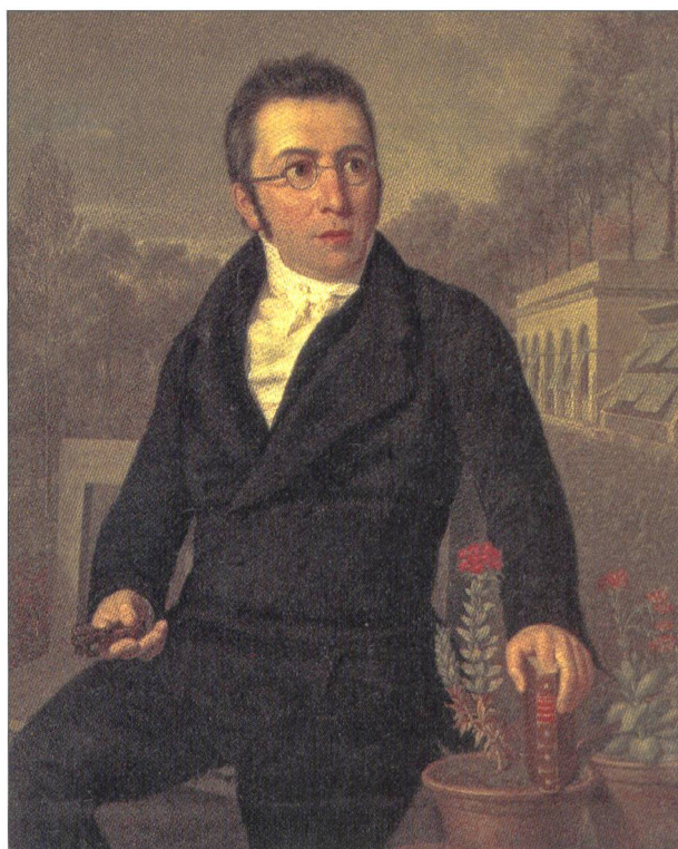
Fig. 1. Augustin-Pyramus de Candolle vers 1822, avec en arrière plan le Jardin botanique des Bastions à Genève. Huile sur toile de Louis Bouvier.

Ces propos, qui attestent de la grande déférence de Senebier pour autrui, rejoignent ceux d'Augustin-Pyramus dans son Histoire de la botanique genevoise . Senebier était un savant, y lit-on, «[t]out occupé de la recherche de la vérité, entièrement étranger à toute vanité, [et] il semblait se faire un devoir de mépriser le charme qui résulte d'un heureux choix d'expressions, et lui-même en convenait avec cette naïveté qui le caractérisait et qui désarmait toute critique» 4 . Reconnu par son biographe Maunoir pour son manque de style dans ses écrits scientifiques 5 , que l'historien Sachs qualifiera comme de la «rhétorique délayée» 6 , mais doué dans l'art de la conversation 7 , Senebier détestait tout particulièrement les louanges qui lui étaient portées. C'est ainsi fermement qu'il demande à Candolle dès sa seconde lettre de cesser tous mots élogieux envers lui 8 . La dédicace à son nom du nouveau genre de plante Senebiera par le botaniste genevois le met mal à