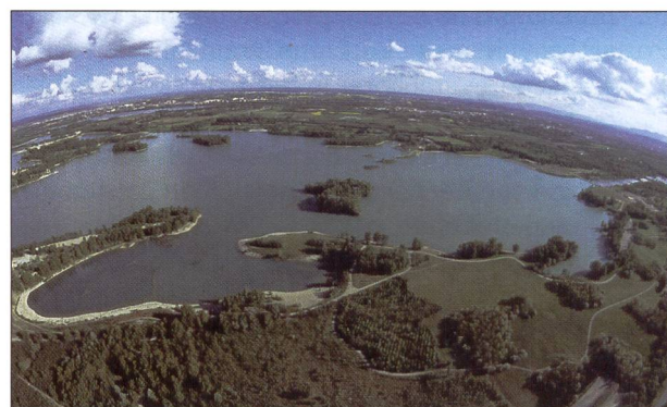
Fig. 6: Le grand parc de Miribel-Jonage près de Lyon.

L'émergence de démarches globales et contractuelles sur les affluents pour les bassins qui n'en sont pas encore dotés et la poursuite de celles engagées est également un enjeu fondamental de ces prochaines années. Les champs d'intervention du volet ressource sont donc les suivants: