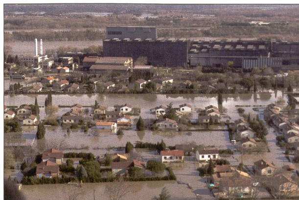
Fig. 3: Inondations en décembre 2003.

L'importance des nombreux enjeux de territoires dont le Rhône est le dénominateur commun, conduit les acteurs en charge de leur développement à vouloir disposer d'un outil de cohérence, à travers l'élaboration et la mise en œuvre d'un projet de dévelop-