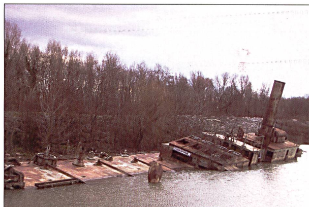
Fig. 7: Le toueur «l'Ardèche», vestige de la marine à vapeur, port de l'Epervière, Valence (Drôme).