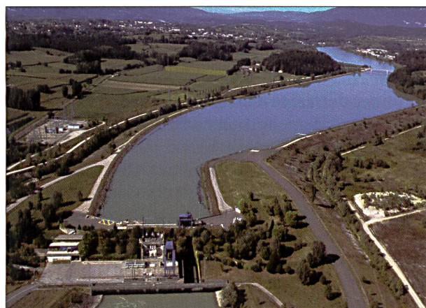
Fig. 1: Usine barrage de Belley (Am).

En effet ce document propose un cadre de politiques publiques structuré à partir de six grands domaines relatifs au développement durable de la vallée rhodanienne. Il ne faut pas penser qu'il s'agisse là de l'émergence d'une «circonscription» rhodanienne, territoire administratif porteur d'un ensemble dynamique d'enjeux considérés à l'échelle du linéaire français. Le Plan Rhône n'a pas non plus pour objet de considérer essentiellement la dimension internationale de ce «petit grand fleuve», mais il manifeste de solides atouts, bénéficiant d'expériences comme celle du «Plan Loire grandeur nature» ( www.plan-loire.fr ) qu'il excède dans plusieurs registres: