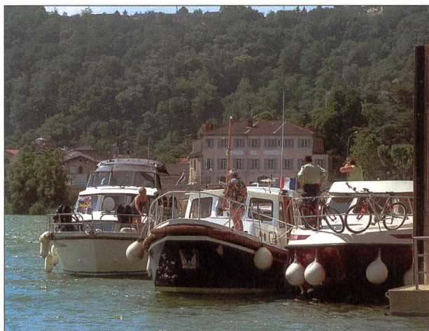
Fig. 8: Plaisanciers devant la Maison du fleuve Rhône (Givors).

Pour faire du fleuve Rhône une véritable destination touristique, ce volet du Plan Rhône affiche une ambition à la hauteur d'un des premiers secteurs d'activité porteur de développement économique pérenne et d'emploi.