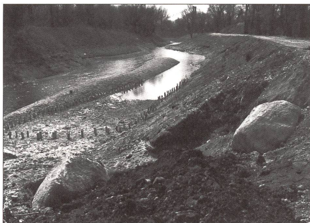
Fig. 5: Programme de restauration des lînes sur l'île de la Table Ronde, en aval de Lyon.

tantes et de la fonctionnalité des ouvrages de protection, à la non augmentation des enjeux exposés aux crues et au maintien de la capacité du lit;