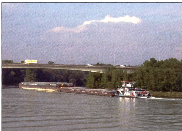
Fig. 2: Convoi poussé à Givors (Rhône).

climat dramatique, à la suite des inondations de décembre 2003, il prend soin de considérer non seulement des problématiques du fleuve en tant que milieu naturel et les aménités qu'il offre, mais aussi des enjeux de développement de la vallée et des territoires adjacents. S'il accorde environ la moitié des moyens qu'il réunit à la prévention des inondations, il consacre la notion de fleuve-patrimoine et la nécessité de cultiver l'attachement des populations au fleuve et aux multiples valeurs qu'il recouvre. Plus encore, il donne sens à cette exigence comme garantie d'une vigilance des sociétés locales quant au devenir de ce bien commun. Ce dernier est désormais placé sous la «bienveillance» d'un panel d'acteurs publics et privés, alors que la CNR a vu inscrite à son cahier des charges une obligation de Missions d'intérêt général, en rapport avec son nouveau métier de producteur d'énergie.