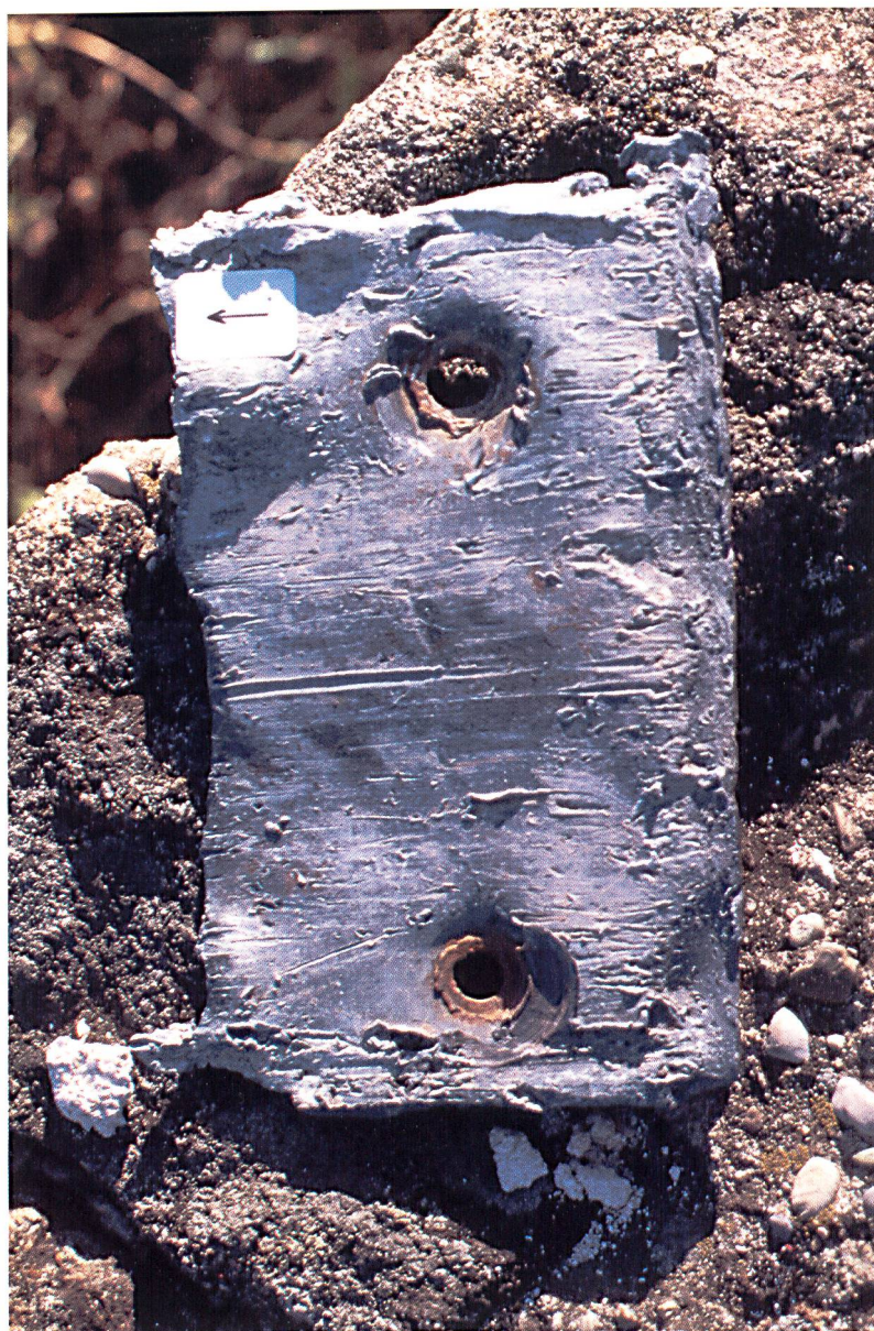
Photo 2. La plaque de plomb telle qu'elle se présentait lors de son retrait, après 7 années sur le calcaire. Les stries sont clairement visibles. En haut à droite, la flèche, de 1 cm de longueur, donne la direction de reptation de la neige.

Des visites de contrôle sont effectuées le 16 octobre de la même année (rien à signaler!), le 21 juin 1989, le 14 août 1991 (de petites raies sont observées), puis le 6 juillet 1994: de nombreuses traces sont alors gravées dans le plomb. La plaque est enlevée le 27 juillet 1995. A l'occasion des trois dernières visites, nous avons chaque fois remarqué que du gravier recouvrait la plaque et les roches alentours. Lors de contrôles à des dates où la neige était encore trop abondante pour permettre d'accéder au dispositif expérimental (mai ou juin), nous avons constaté la présence de blocs de neige en cours de descente à partir des pentes raides qui dominaient en direction des couloirs séparant les tours. Ces goulets d'étranglement obligeaient les blocs