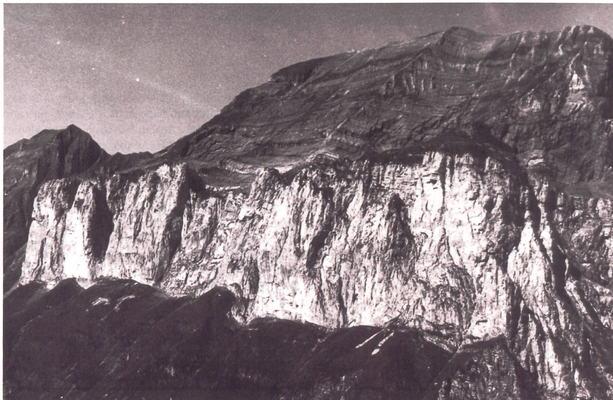
Photo 1. Vue aérienne de la paroi des Tours d'Areu. En haut à droite, la Pointe d'Areu (2478 m). A gauche, le col de la Forcle (2433 m).

La paroi des Tours d'Areu est formée des calcaires du Barrémien (faciès urgonien), de 180 à 200 m de puis-