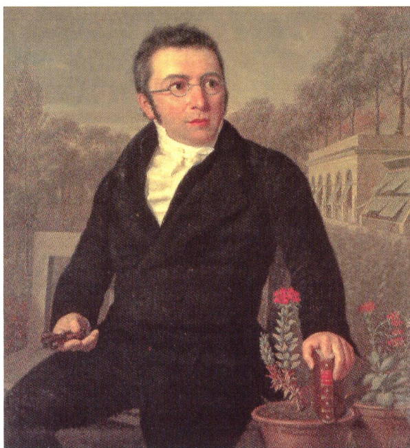
Fig. 2 Augustin-Pyramus de Candolle à 44 ans, tenant la Théorie élémentaire de la botanique dans la main gauche et une loupe dans la main droite, avec pour arrière plan le premier jardin botanique de Genève situé sur l'emplacement actuel du Parc des Bastions. Huile sur toile de Louis Bouvier (1822). Genève, Société des Arts.

œuvre scientifique. De ses premiers travaux anatomiques et physiologiques (ou plutôt de «physique végétale» comme on disait à l'époque) 1 jusqu'à ses dernières publications, consacrées à décrire, nommer et classer l'ensemble des espèces végétales connues à l'époque, Candolle a laissé derrière lui une œuvre qui frappe par son abondance et sa diversité, et qui inclut quelques travaux d'agronomie ainsi que des études visant à améliorer la condition de ses semblables. Son témoignage autobiographique, enfin restituée dans son intégralité d'après le manuscrit conservé dans la famille de Candolle 2 , nous dévoile, par-delà la stature du grand savant, un personnage haut en couleurs, qui avait un goût peu modéré pour les belles femmes, un