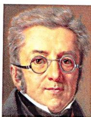
Fig. 1: Portrait d'Augustin-Pyramus de Candolle (détail). Huile sur toile de Joseph Hornung (1839). Genève, bibliothèque publique et universitaire (BPU).