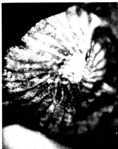
Nummulites incrassatus de la Harpe. Forme B. 10 ×