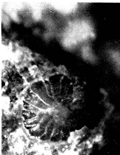
Nummulites incrassatus de la Harpe. 10 ×