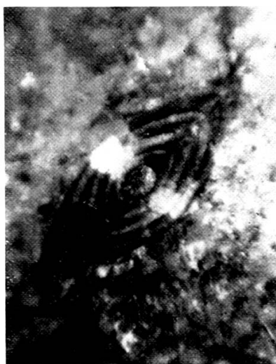
Nummulites incrassatus de la Harpe. 10 ×

Nummulites incrassatus de la Harpe du calcaire priabonien des Journelles, région SW de la boutonnière autochtone de Champéry.