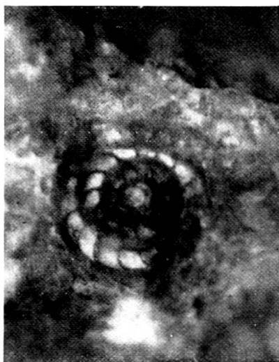
Nummulites incrassatus de la Harpe. Forme A. 10 ×