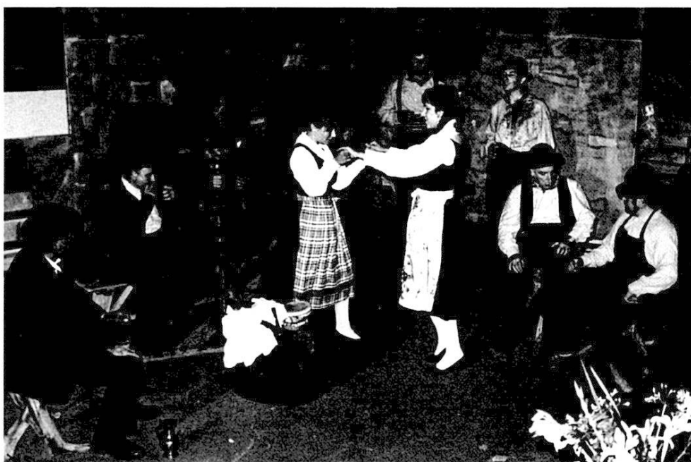
Les promesses de Napoléon au pressoir du Président, avec les Compagnons du Bisse, Savièse. Photo Marie-Dominique Liand, 1987.

Souvent, on complétait le A rêvè par Pourta tè biin , Porte-toi bien ! ou Porta vo biin , Portez-vous bien !