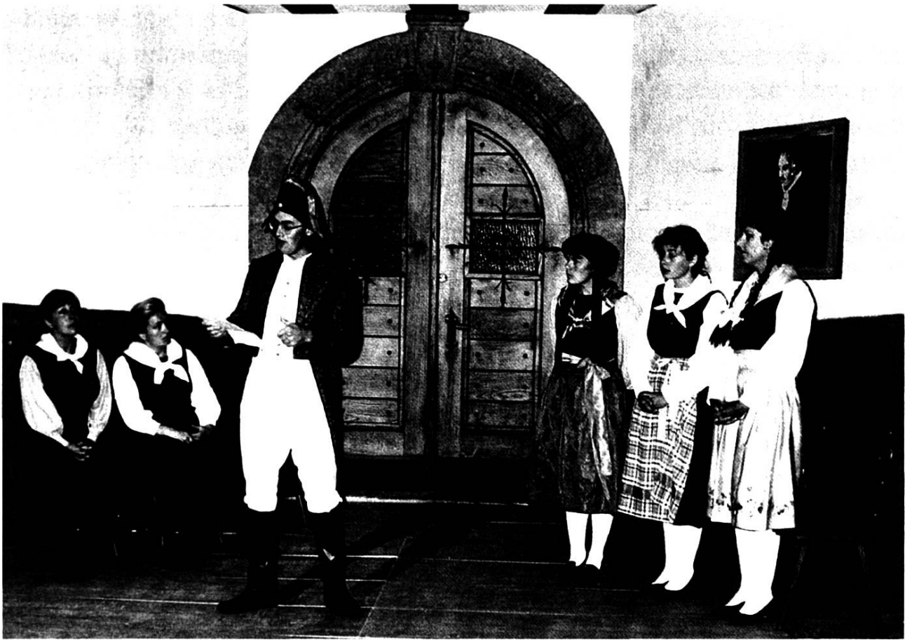
Les promesses de Napoléon avec les Compagnons du Bisse, Savièse.