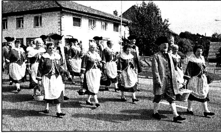
Les Aidjolats durant le cortège.

laingaidge ât encoué brament djâsaie, aije bîn qu'le français, po nôs âtres ç' ât in pô pus du, mains nôs l'aipprennant in pô meu tos les djoués. I aipeul tchu les lavons les Aidjolats.