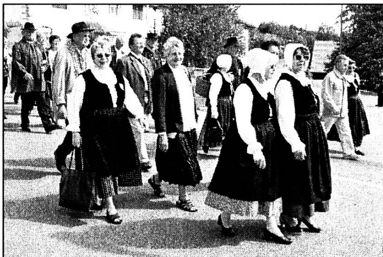
La Trouée de Belfort.

C' est la plus jeune de nos équipes de patoisants. Nous avons eu le plaisir de les voir participer à cette première fête à Trévillers il y a deux mois et demi. Nous sommes heureux de les recevoir aujourd' hui.