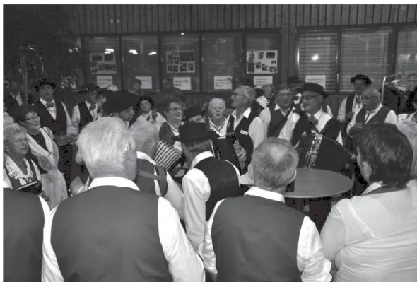
Temps de rencontre.