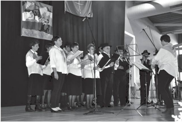
I Fayerou de Bagnes.