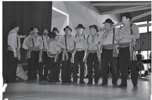
Les organisateurs : Société des Costumes et Patois de Savièse.