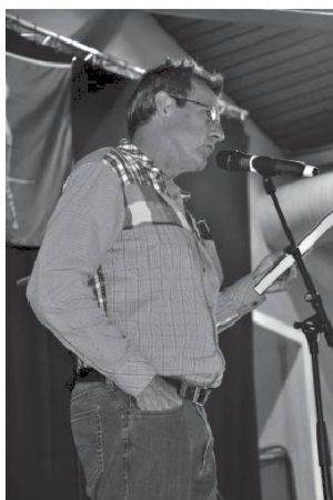
Cóbla dou Patoué dé Ninda.