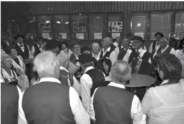
Temps de rencontre.

Kyën pliji pó nóoutra sousiétéi dé rechivré sti an 2016 nó j-ami dou patoué kyé venyon dé tui é couën é é caró dou Vaoui ! Nó oudran kyé tsecoun poouéché partadje sté cakyé j-ouré ën téré chavyejan.né avouéi bonöö é amitchyé, ën méclin é voué joyoujé dé nó presyou patoué. Vou' éité tóte é tui é byin.enou !