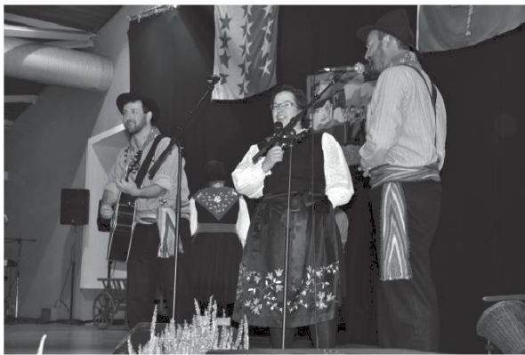
Chant en patois.

Kyèn pliji pó nóoutra sousiétéi dé rechivré sti an 2016 nó j-ami dou patoué kyé venyon dé tui é couën é é caró dou Vaoui ! Nó oudran kyé tsecoun poouéché partadjyé sté cakyé j-ouré ën téré chavyejan.né avouéi bonöö é amitchyé, ën méclin é voué joyoujé dé nó presyou patoué. Vou' éité tóte é tui é byin.enou !