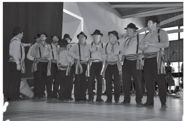
Les organisateurs : Société des Costumes et Patois de Savièse.