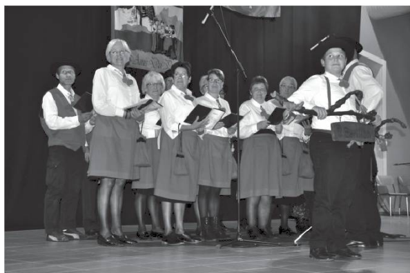
O Barillon de Chamoson.

Magnifique rencontre organisée par les Saviésans...en images miniatures !