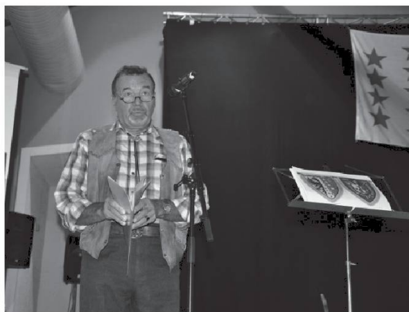
Comona vaouéjan.na dé Dzénéva.