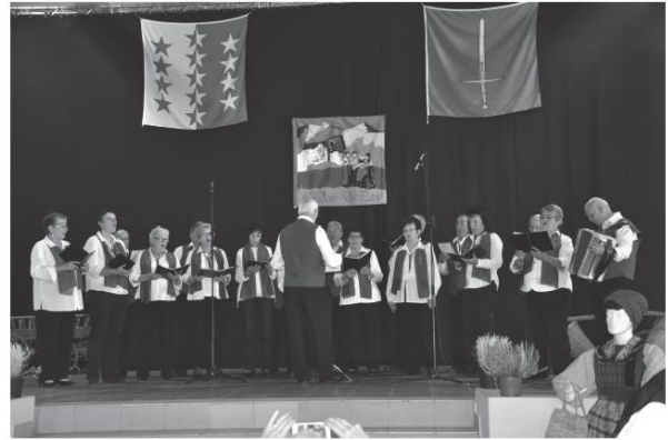
Lou Tré Nant de Troistorrents.