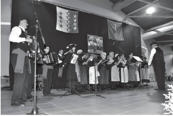
A Cobva de Conthey.

Kyën pliji pó nóoutra sousiétéi dé rechivré sti an 2016 nó j-ami dou patoué kyé venyon dé tui é couën é é caró dou Vaoui ! Nó oudran kyé tsecoun poouéché partadje sté cakyé j-ouré ën téré chavyejan.né avouéi bonöö é amitchyé, ën méclin é voué joyoujé dé nó presyou patoué. Vou' éité tóte é tui é byin.enou !