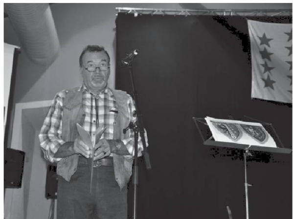
Comona vaouéjan.na dé Dzénéva.