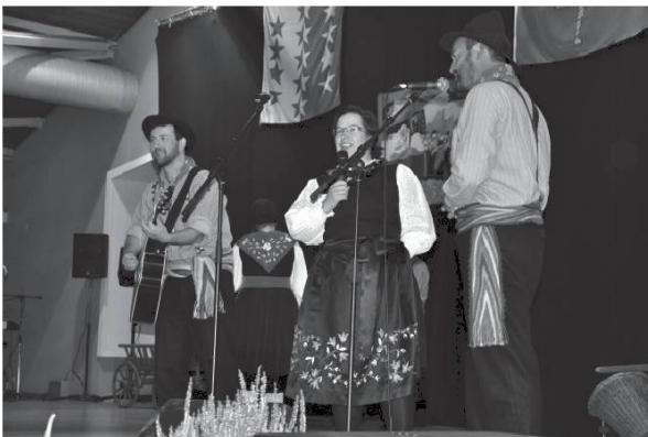
Chant en patois.

Quel plaisir pour notre société d'accueillir en cette année 2016 nos amis patoisants provenant des quatre coins du Valais ! Notre vœu le plus cher est que chacun d'entre vous puisse partager un magnifique moment de convivialité et d'amitié en terres de Savièse au son de nos précieux et uniques dialectes. Bienvenue à toutes et à tous !