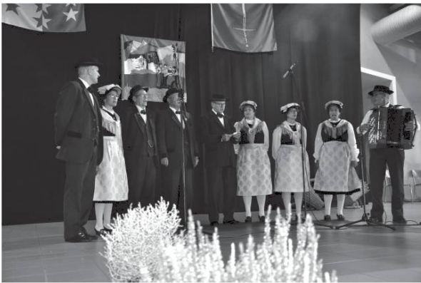
Lé Partichyou de Chermignon.