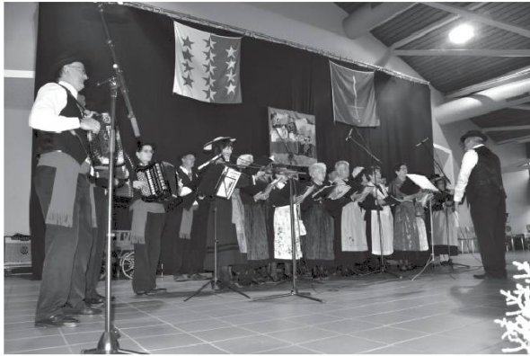
A Cobva de Conthey.