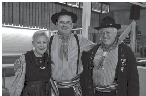
Société des Costumes et Patois de Savièse. Photos Bretz, 2016.