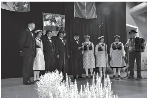
Lé Partichyou de Chermignon.