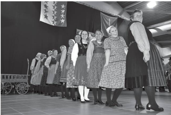
Les organisateurs : Société des Costumes et Patois de Savièse.