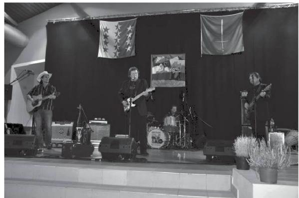
Concert Paul Mac Bonvin.

Quel plaisir pour notre société d'accueillir en cette année 2016 nos amis patoisants provenant des quatre coins du Valais ! Notre vœu le plus cher est que chacun d'entre vous puisse partager un magnifique moment de convivialité et d'amitié en terres de Savièse au son de nos précieux et uniques dialectes. Bienvenue à toutes et à tous !