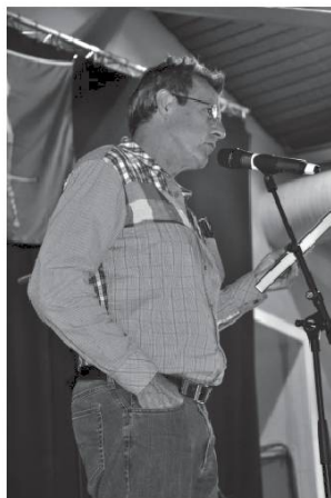
Cóbla dou Patoué dé Ninda.