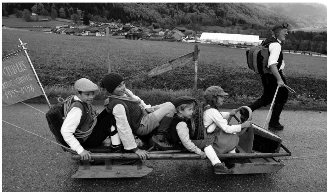
Poya d'Estavannens. Loisirs à la montagne.

Samuel Cornut – cité par Alfred Cérésolle dans son texte « Défendons le patois » paru dans le Messager boiteux (1903)