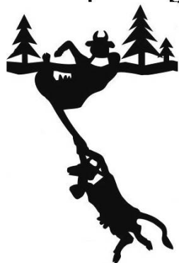
Pat von N.

Je me réjouis que des personnes ou des institutions – pas ou peu initiées au patois – s'intéressent aux patois, qu'elles fassent appel aux patoisants, reconnaissent leur savoir-dire et offrent ainsi de magnifiques occasions de mettre en valeur nos patois. Je me réjouis de pouvoir compter, malgré des emplois du temps chargés, sur des patoisants volontaires, heureux de rendre service et de partager leurs connaissances : chers Amis, vous êtes le Patois en Vie !