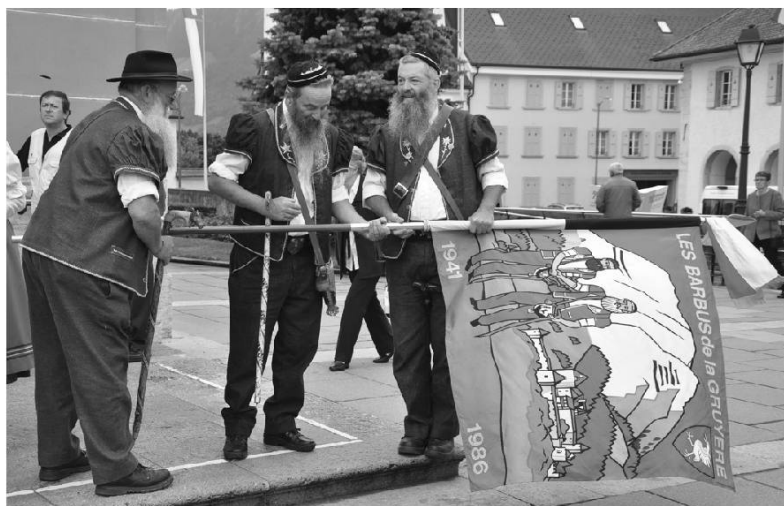
Les Barbus de la Gruyère.