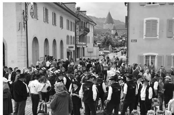
Ambiance à Bulle avant le cortège.