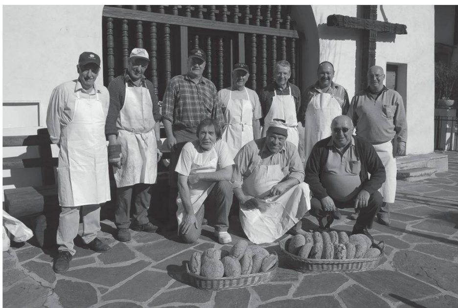
L'équipe de travail devant la chapelle de Drône.