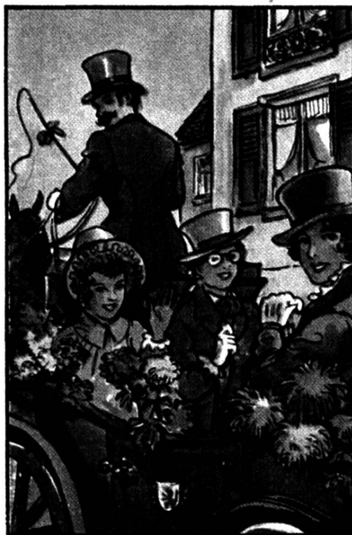
Les jeunes citoyennes de Morat. Fête de jeunesse. Nestlé, 1954.

Charmey (FR), sur l'alpage de Vounetz, dimanche 15 août 2010, à 10.30 h. Messe chantée et homélie en patois , par les fidèles présents. L'accès se fait au moyen des remontées mécaniques ou à pied.