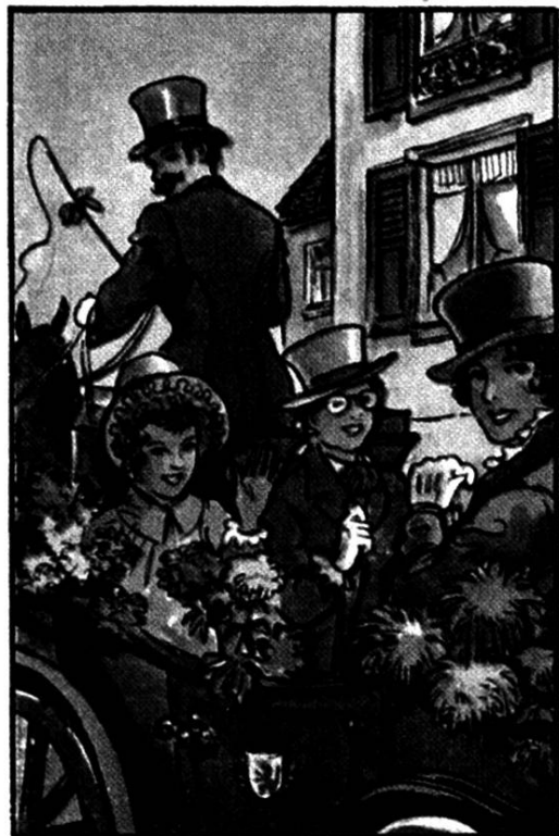
Les jeunes citoyennes de Morat. Fête de jeunesse. Nestlé, 1954.

Charmey (FR), sur l'alpage de Vounetz, dimanche 15 août 2010, à 10.30 h. Messe chantée et homélie en patois , par les fidèles présents. L'accès se fait au moyen des remontées mécaniques ou à pied.