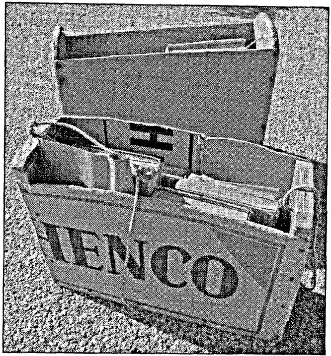
La stéca , sac pour l'école des « grands », utilisé par les garçons à Savièse dans les années 1950.

S'agissant d'une langue essentiellement parlée, le rôle du rèjian est de leur apprendre à lire et à écrire en relevant les principales règles de grammaire, en complétant le vocabulaire et en leur faisant découvrir le mystère de la conjugaison des verbes. L'animateur s'aide pour cela du livre Predzin patoué , « 41 leçons de patois valaisans accompagnées de notices grammaticales », édité en 1990 par la Fédération valaisanne des amis du patois.