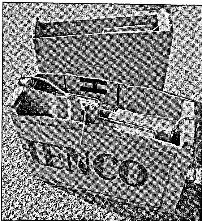
La stéca , sac pour l'école des « grands », utilisé par les garçons à Savièse dans les années 1950.

Ensemble, serrons-nous les coudes pour sauver le patois !